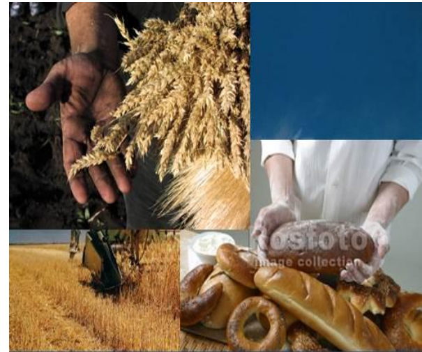
Золотые руки хлеборобов