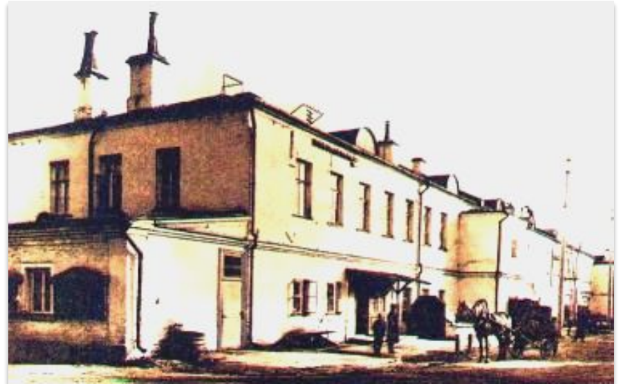
Завод братьев Мамонтовых

В результате сократилось производство в металлургии и суконной промышленности.