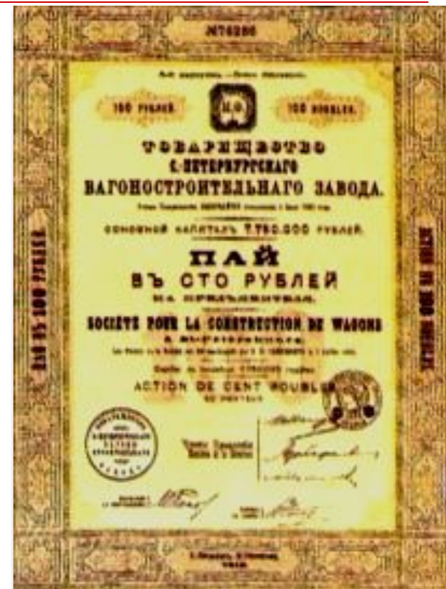
Акция вагоностроительного завода