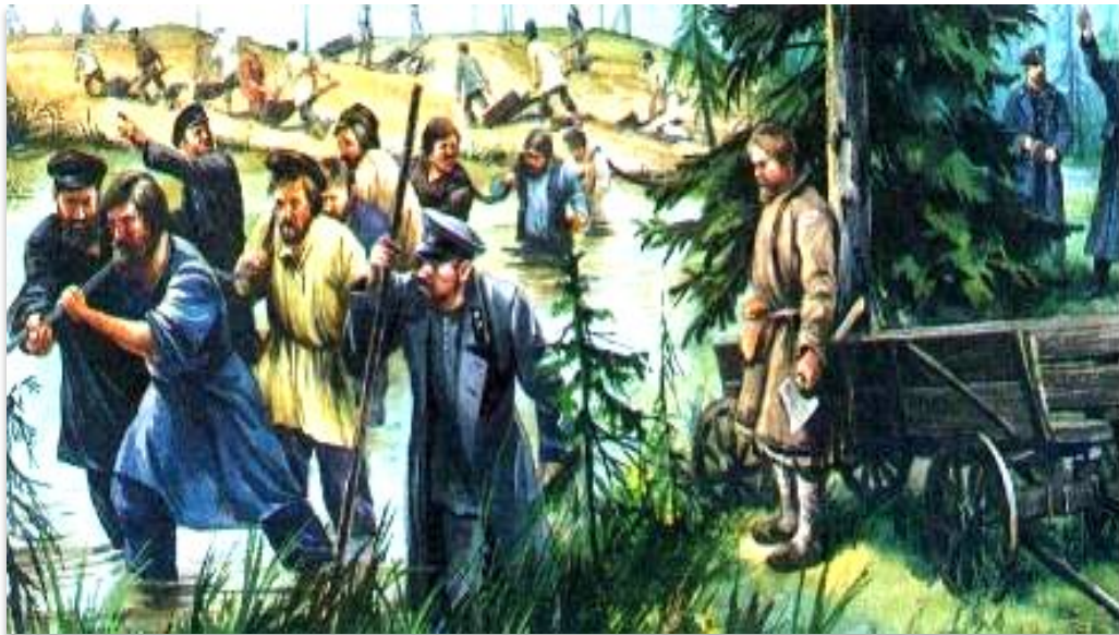
Строительство железной дороги.

Транспортная сеть выросла с 2 тыс. до 22 тыс. км дорог. Появились предприниматели, разбогатевшие на таком строительстве.