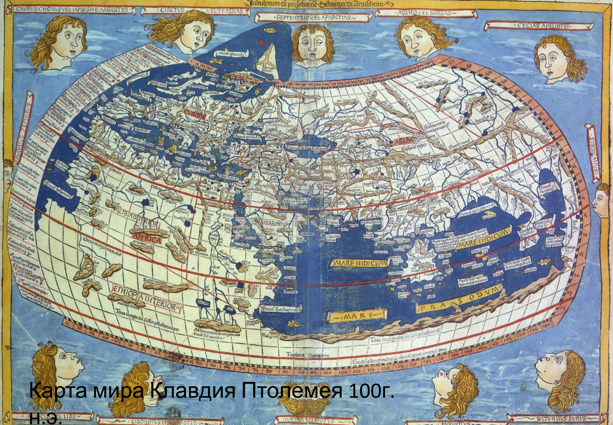
Карта мира Клавдия Птолемея 100г.