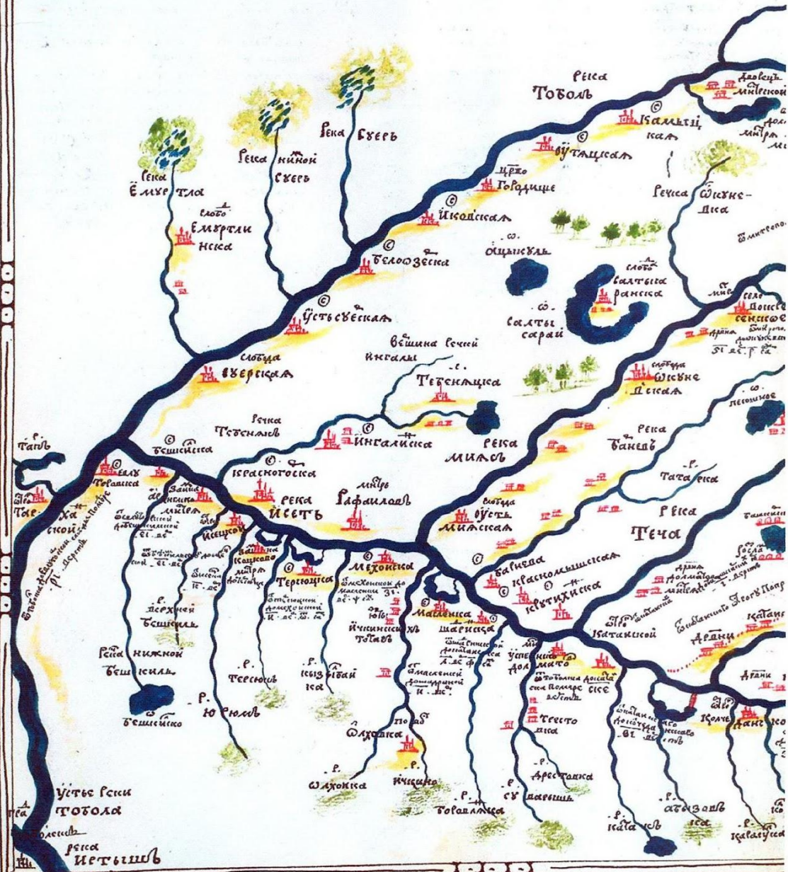
Карта Семена Ремезова 1695г.