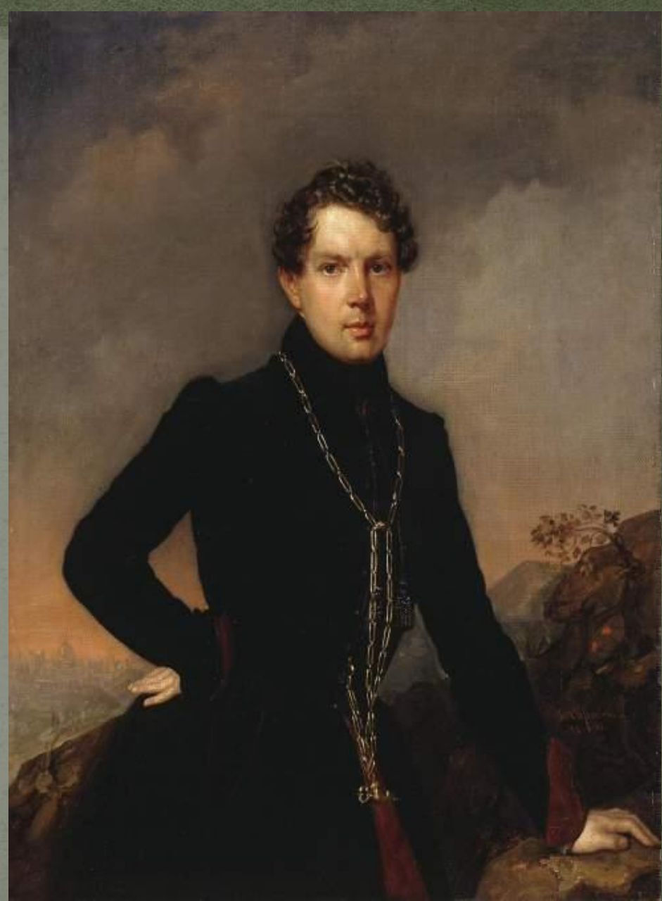
А. Н. Муравьёв (1806–1874)

«Мне случилось однажды уловить лучшую минуту его вдохновения. В летний вечер я застал его за письменным столом, с пылающим лицом и с огненными глазами, которые были у него особенно выразительны. «Что с тобою?» – спросил я.