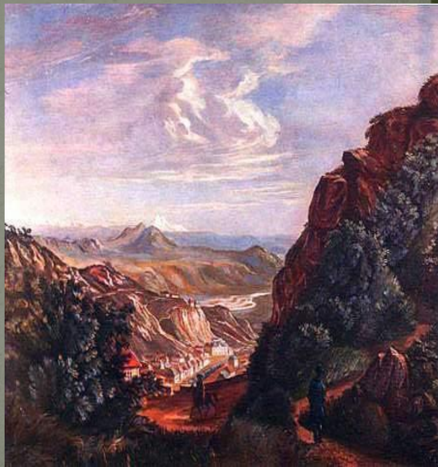
М.Ю. Лермонтов «Вид Пятигорска»

«Хотя на миг когда- нибудь мою пылающую грудь прижать с тоской к груди другой, хоть незнакомой, но родной».