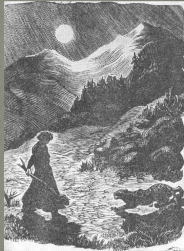
М.Н. Орлова-Мочалова «Бой с барсом»

Мцыри стремится «в тот чудный мир тревог и битв, где в тучах прячутся скалы, где люди вольны, как орлы».