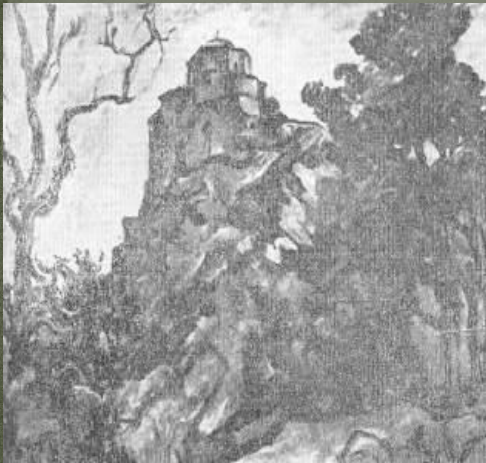
П.П. Кончаловский «Гроза»