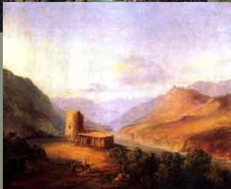
М.Ю. Лермонтов "Военно-Грузинская дорога близ Мцхеты"