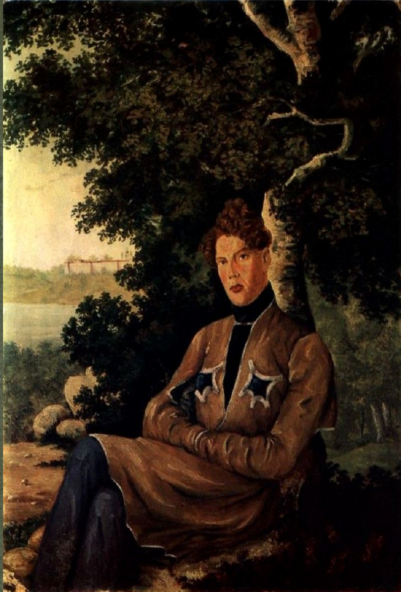
М. Ю. Лермонтов Портрет Андрея Николаевича Муравьева

«Слушай», – сказал он, и в ту же минуту, в порыве восторга, прочёл мне, от начала до конца, всю свою великолепную поэму «Мцыри», которая только что вылилась из-под его вдохновенного пера. Внимая ему, и сам я пришёл в невольный восторг: так живо выхватил он, из недр Кавказа, одну из разительных сцен и облёк её в живые образы перед очарованным взором. Никогда никакая повесть не производила на меня столь сильного впечатления...»