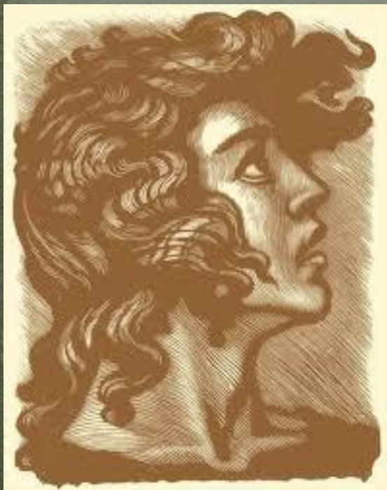
Ф.Н. Константинов «Мцыри». Гравюра

Какие слова подтверждают это его состояние?