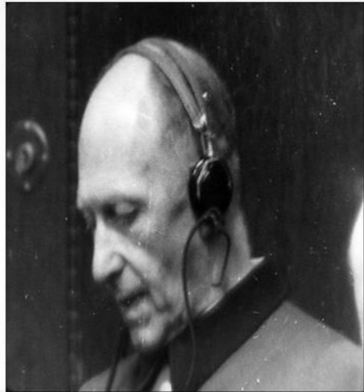
Начальник Генерального штаба вермахта генерал от инфантерии Альфред фон Иодль.