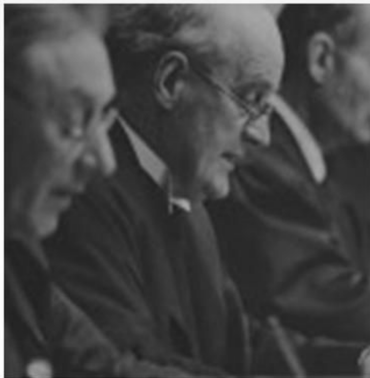
Британский судья Джеффри Лоуренс