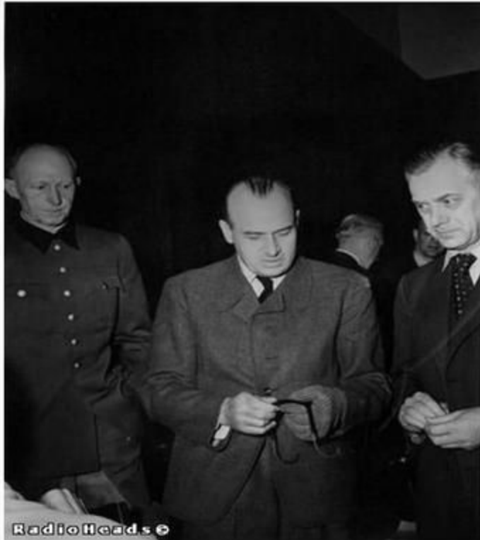
А. Розенберг -главный идеолог нацизма, рейхсминистр по делам оккупированных восточных территорий