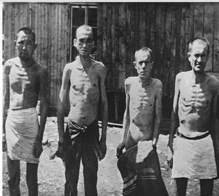
Советские военнопленные в концентрационном лагере Маутхаузен. Австрия, январь 1942 года.