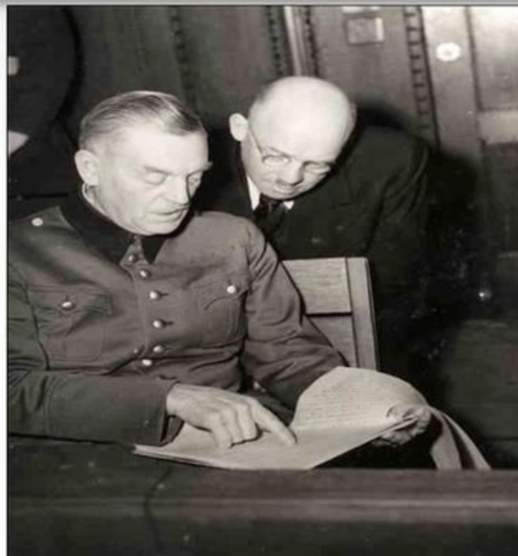
Уполномоченный по трудоиспользованию Ф. Заукель и начальник штаба ОКВ генерал-фельдмаршал Вильгельм Кейтель