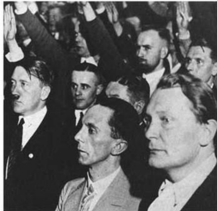
А.Гитлер , Г.Геринг на митинге.