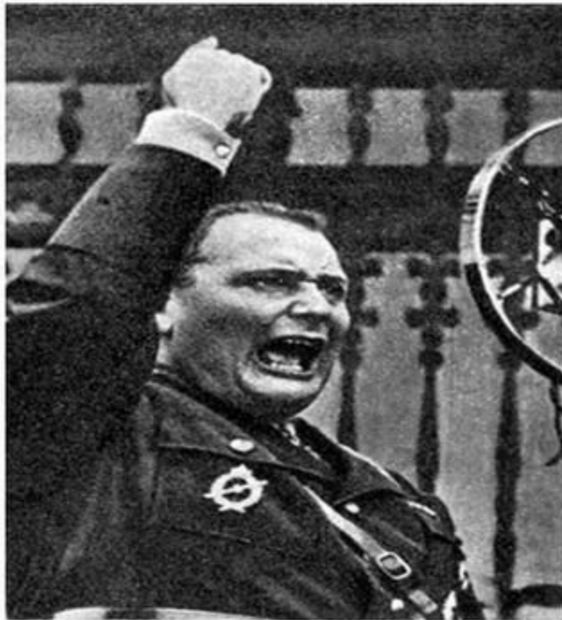
Герман Геринг на трибуне