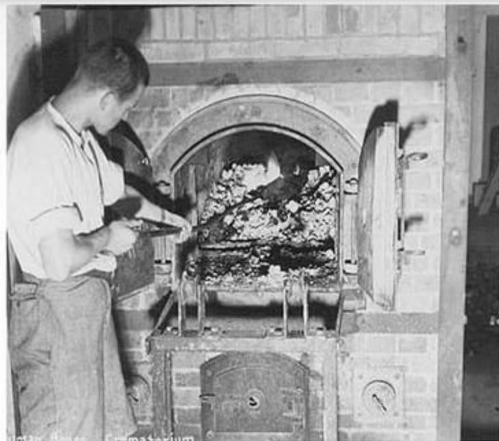
Человеческие останки, найденные в крематории концентрационного лагеря Дахау