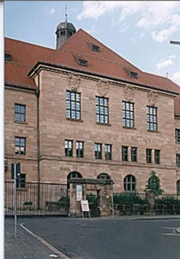
Здание суда присяжных.

Нюрнбергский процесс — международный судебный процесс над бывшими руководителями гитлеровской Германии. Проходил с 20 ноября 1945г. по 1 октября 1946 г. в Международном военном трибунале в Нюрнберге (Германия), располагавшемся в «Зале 600» здания суда присяжных.