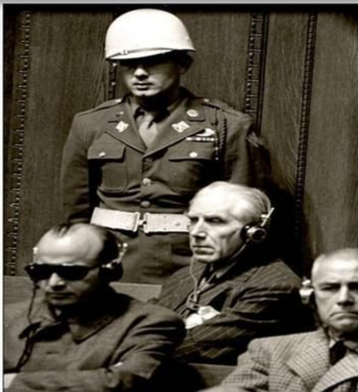
Подсудимый В. Функ на скамье подсудимых во время Нюрнбергского процесса.