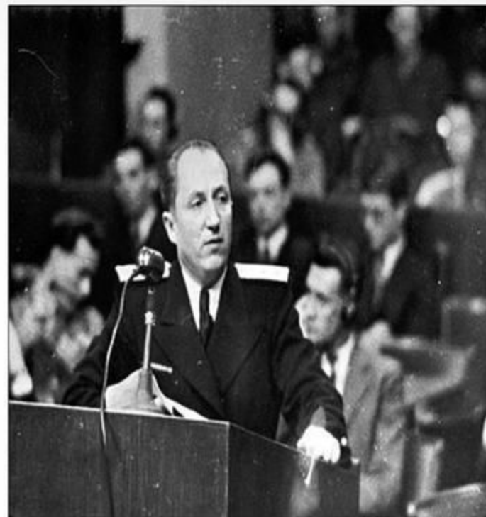
Главный обвинитель от СССР Руденко Р.А.