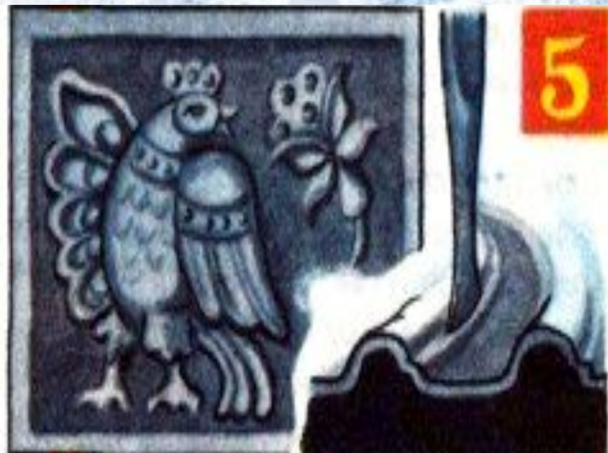
5. Уточнение деталей чеканом - расходником