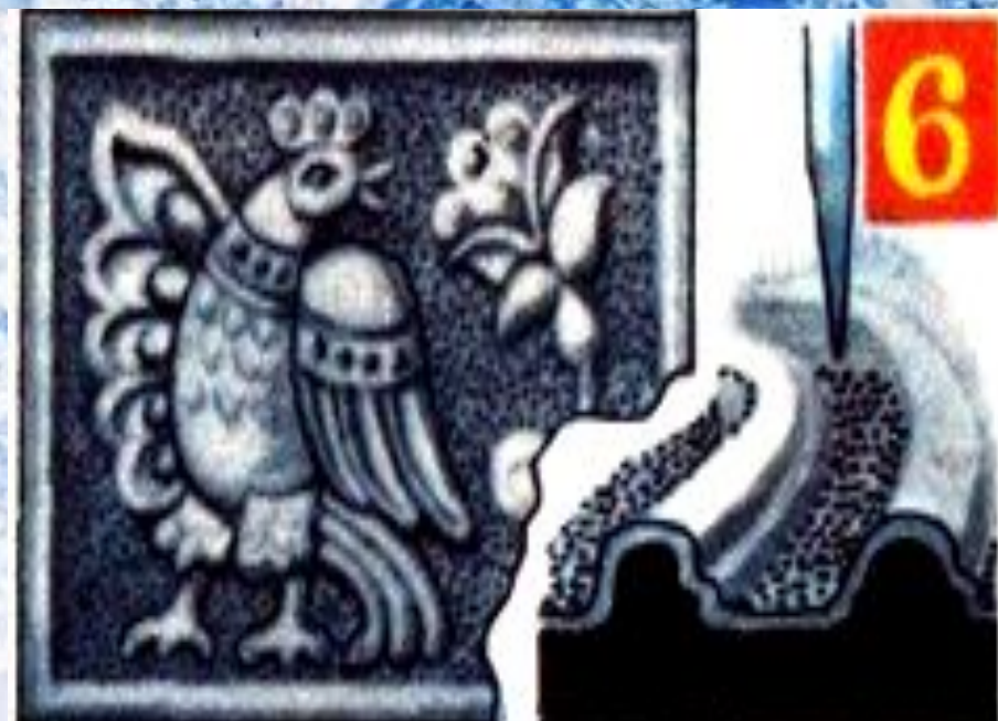
6. Отделка фона чеканом - канфарником