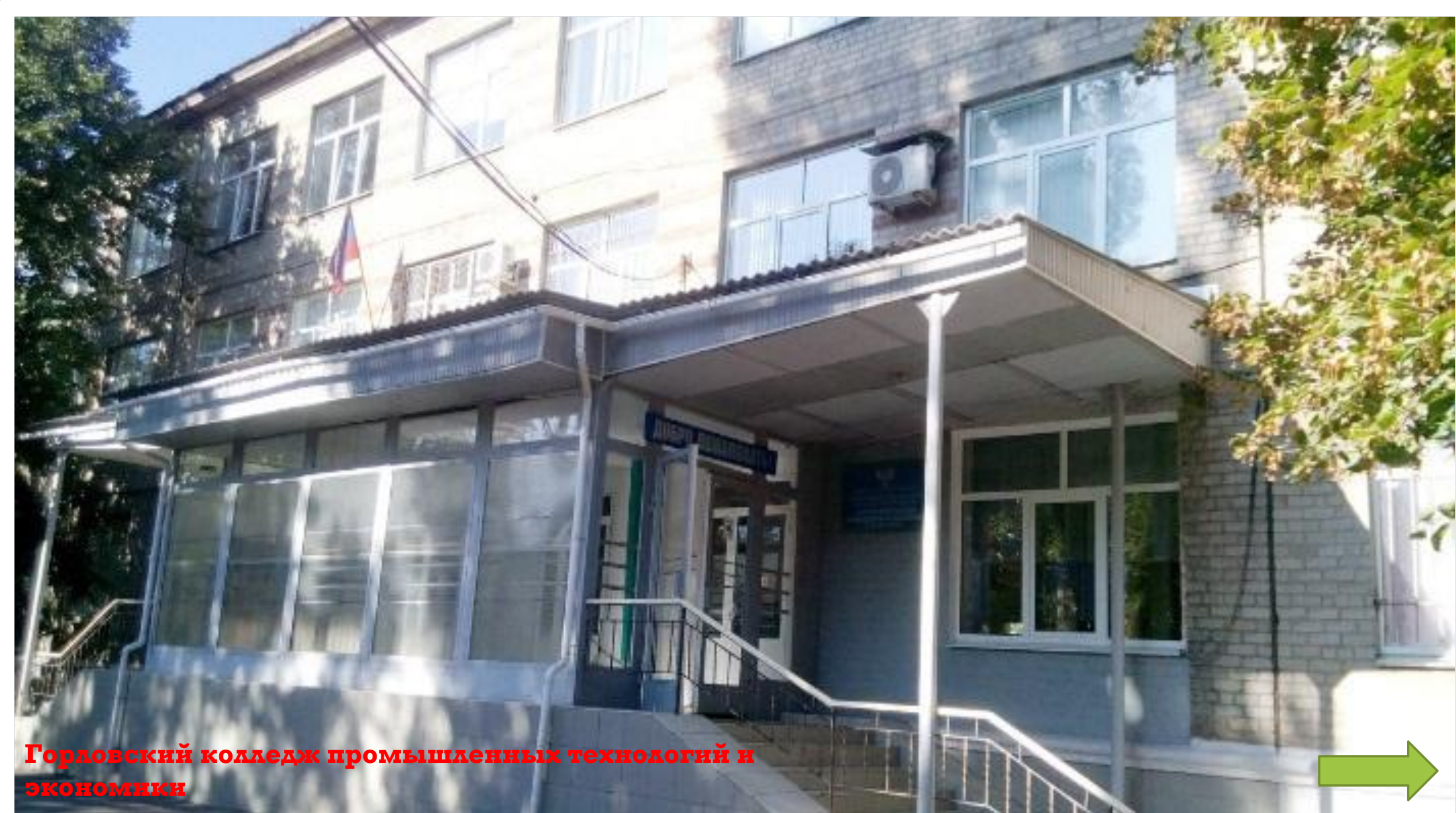
Горловский колледж промышленных технологий и экономики