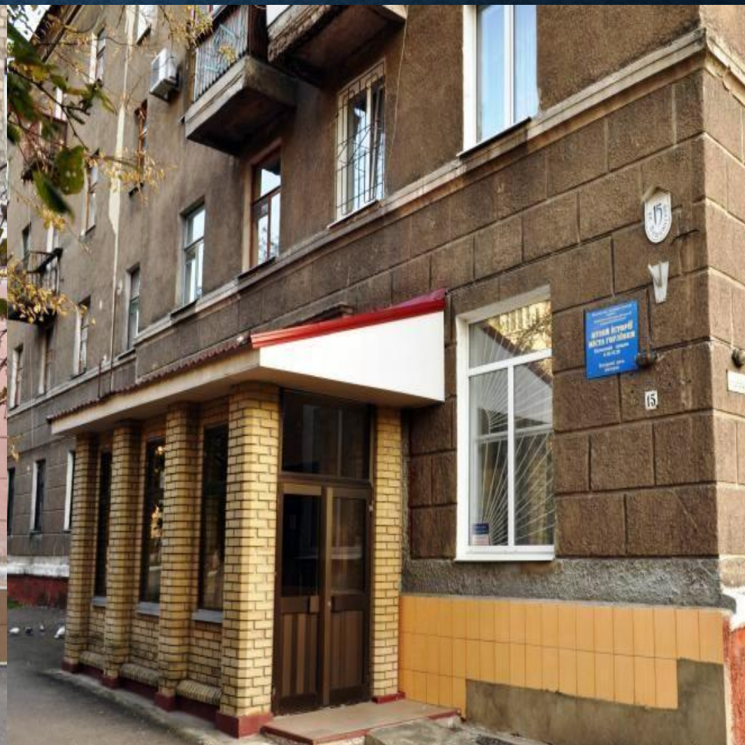
Исторический музей города Горловка