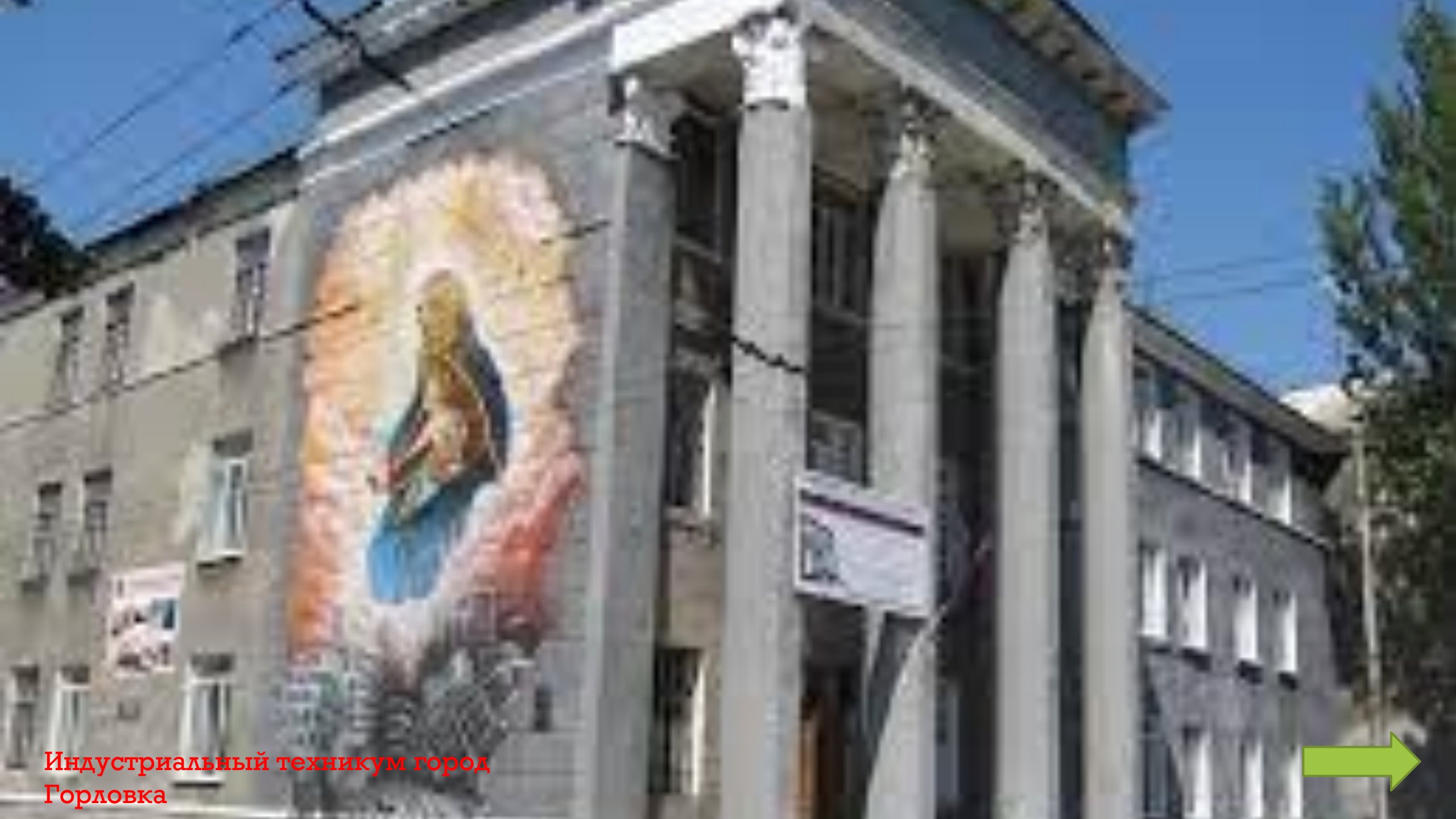
Индустриальный техникум город Горловка