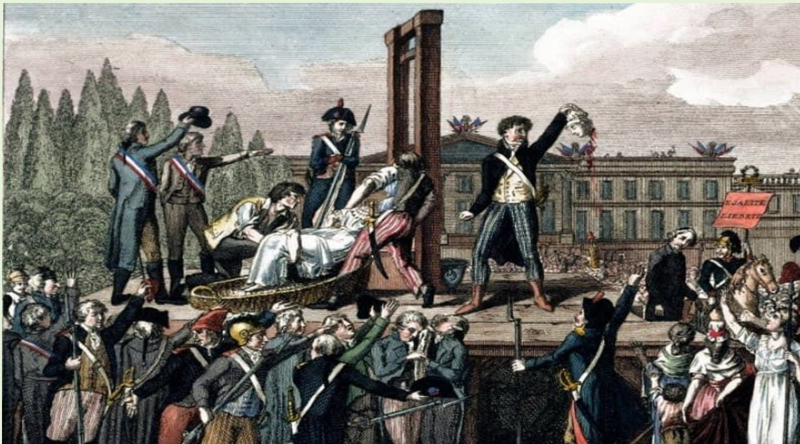
Палач демонстрирует собравшимся отрубленную голову Марии Антуанетты, 1793

В декабре 1792 года Людовика приговорили к смерти «за злоумышления против свободы, нации и преступления против человечества». 21 января 1793 года король был обезглавлен на гильотине. Осенью того же года казнили и королеву.