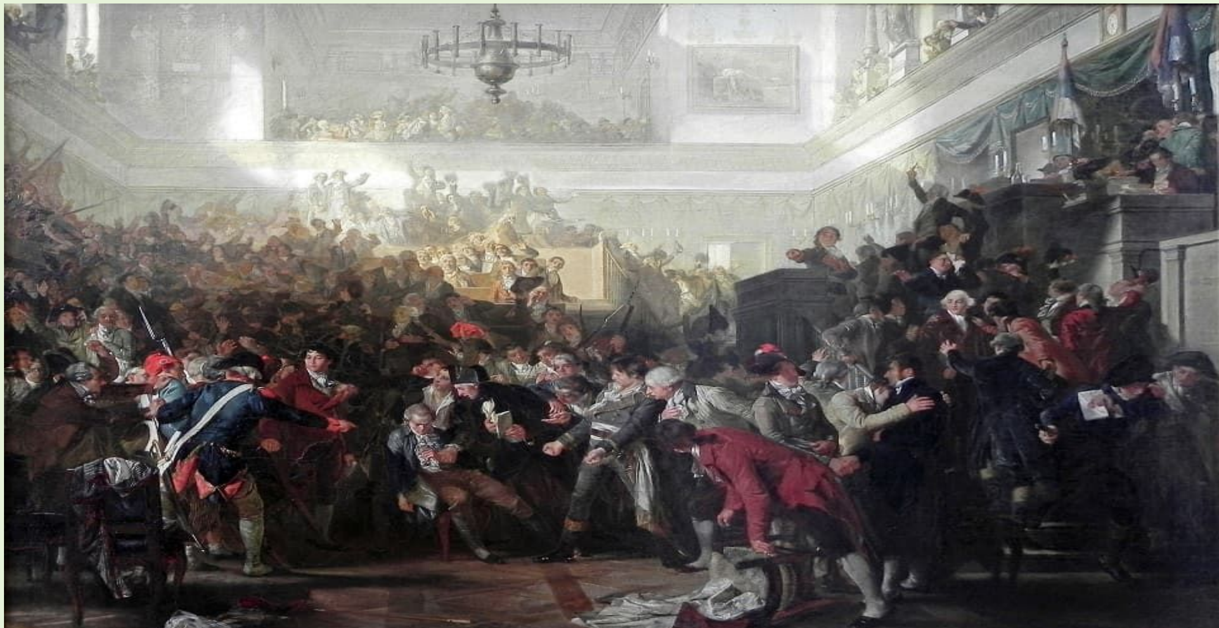
Макс Адамо, «Свержение Робеспьера в Национальном конвенте 27 июля 1794 года»