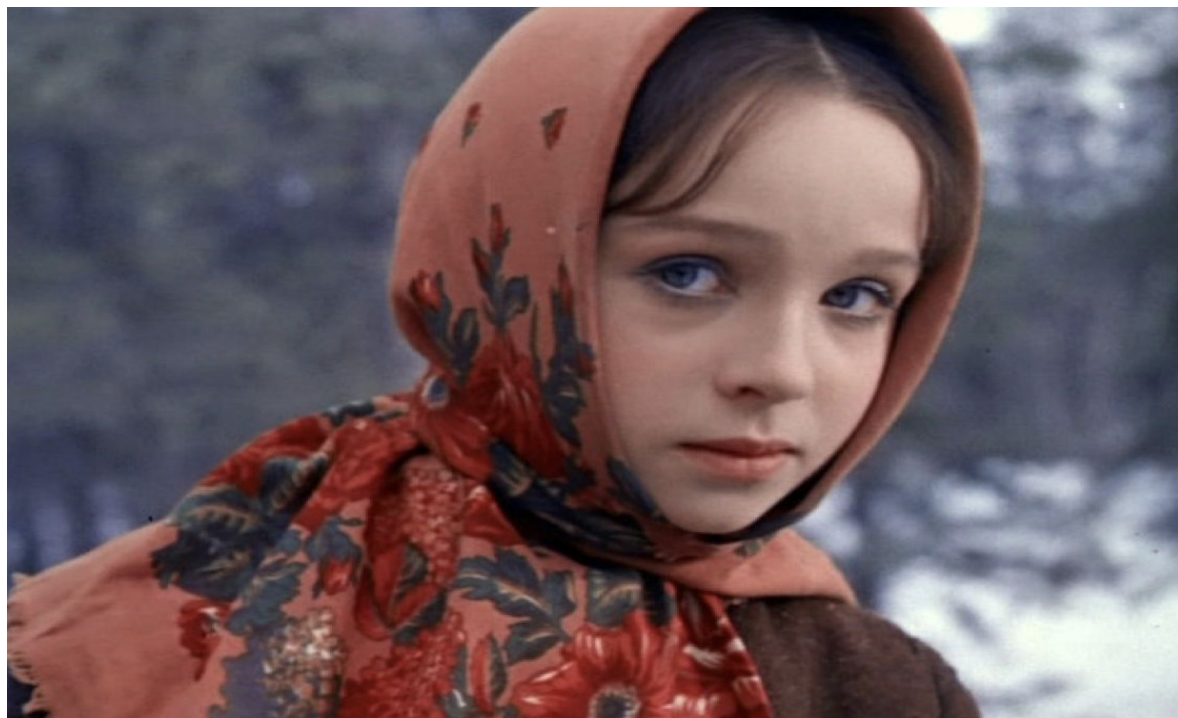
Кадр из фильма «Морозко»

Вам понадобится сделать фотографию, дублирующую известный кадр из фильма.