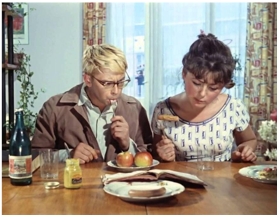
«Гостя из будущего»