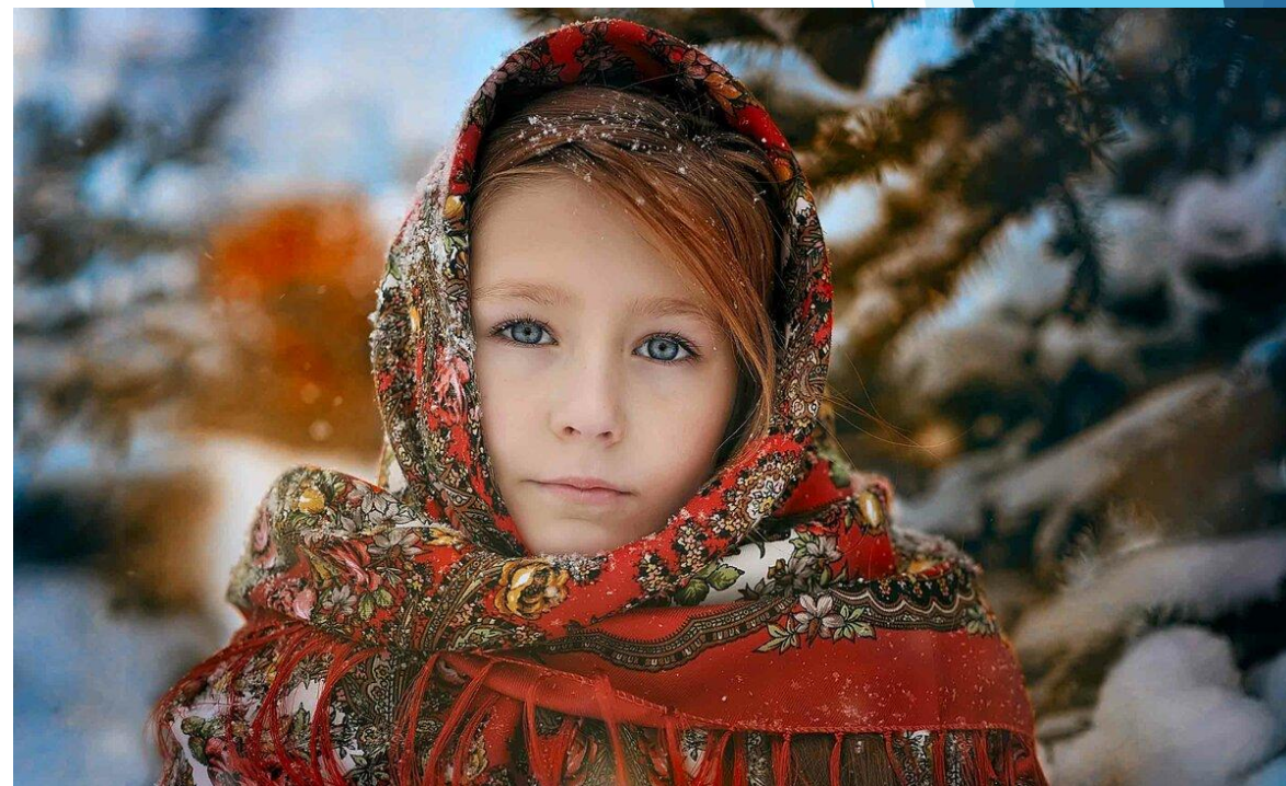
Современный дубль кадра из фильма «Морозко»