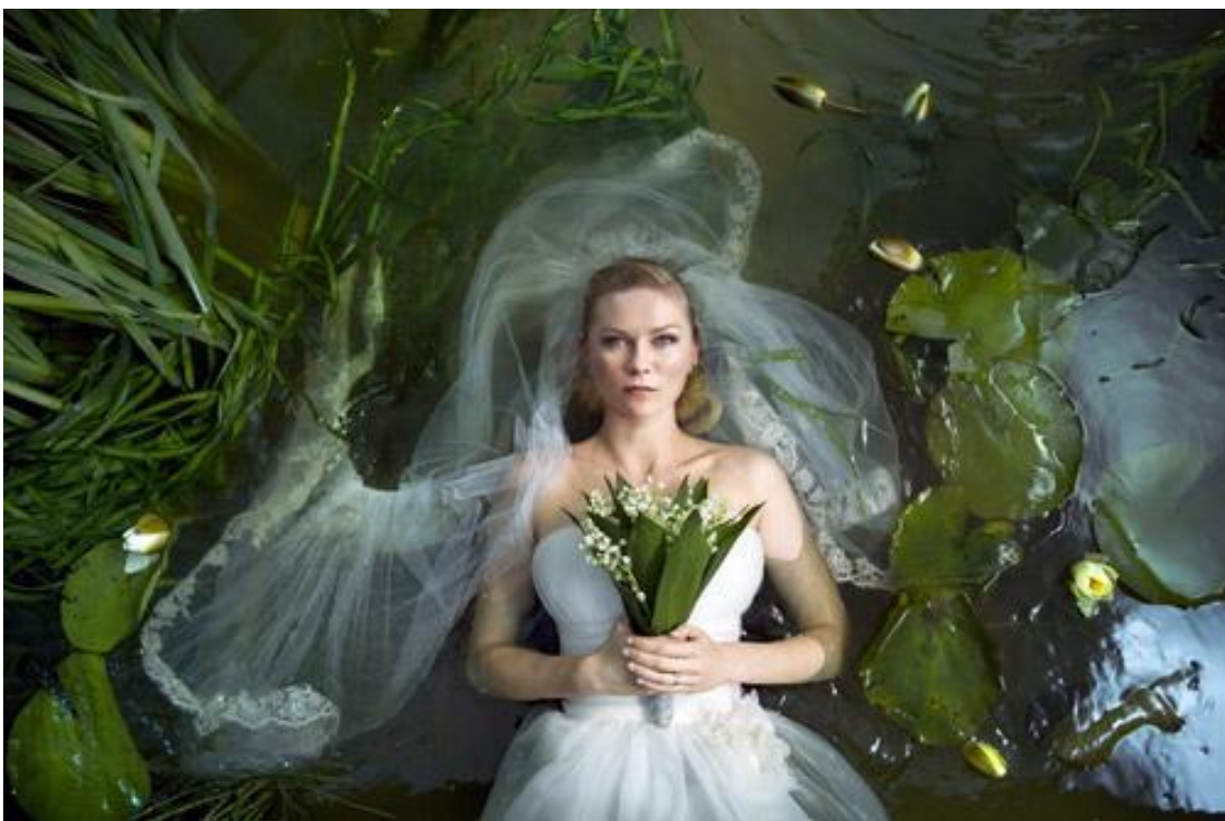
Кадр из фильма «Меланхолия»

Создавайте окружающую обстановку своими руками!