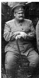
Генерал Крымов – участник кирилловского мятежа