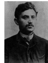
Г.Е. Зиновьев – член заседания большевиков, не поддержавший резюлюция Ленина о вооружённом захвате власти