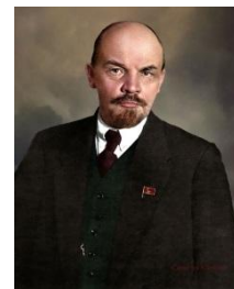
В.И. Ленин – лидер партии большевиков, один из организаторов октябрьской революции