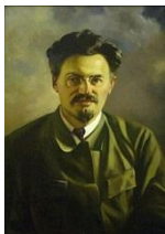
Л. Д. Троцкий – руководитель Военно- революционным комитетом (ВРК)