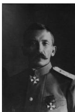
Л.Г. Корнилов – с июня 1917 г. Главкомандующий армии. 31 августа организовал мятеж с целью захвата власти