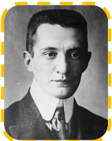
Ф. А Керенский – председатель временного правительства, который сменил В Львова