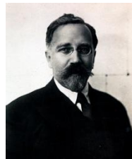
С. Е. Каменев – член заседания большевиков, не поддержавший резюлюция Ленина о вооружённом захвате власти