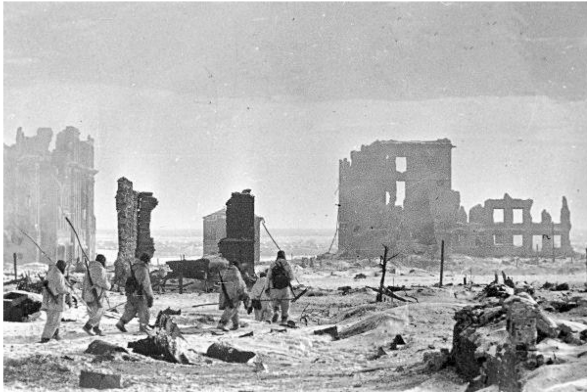
Центр Сталинграда 2 февраля 1943