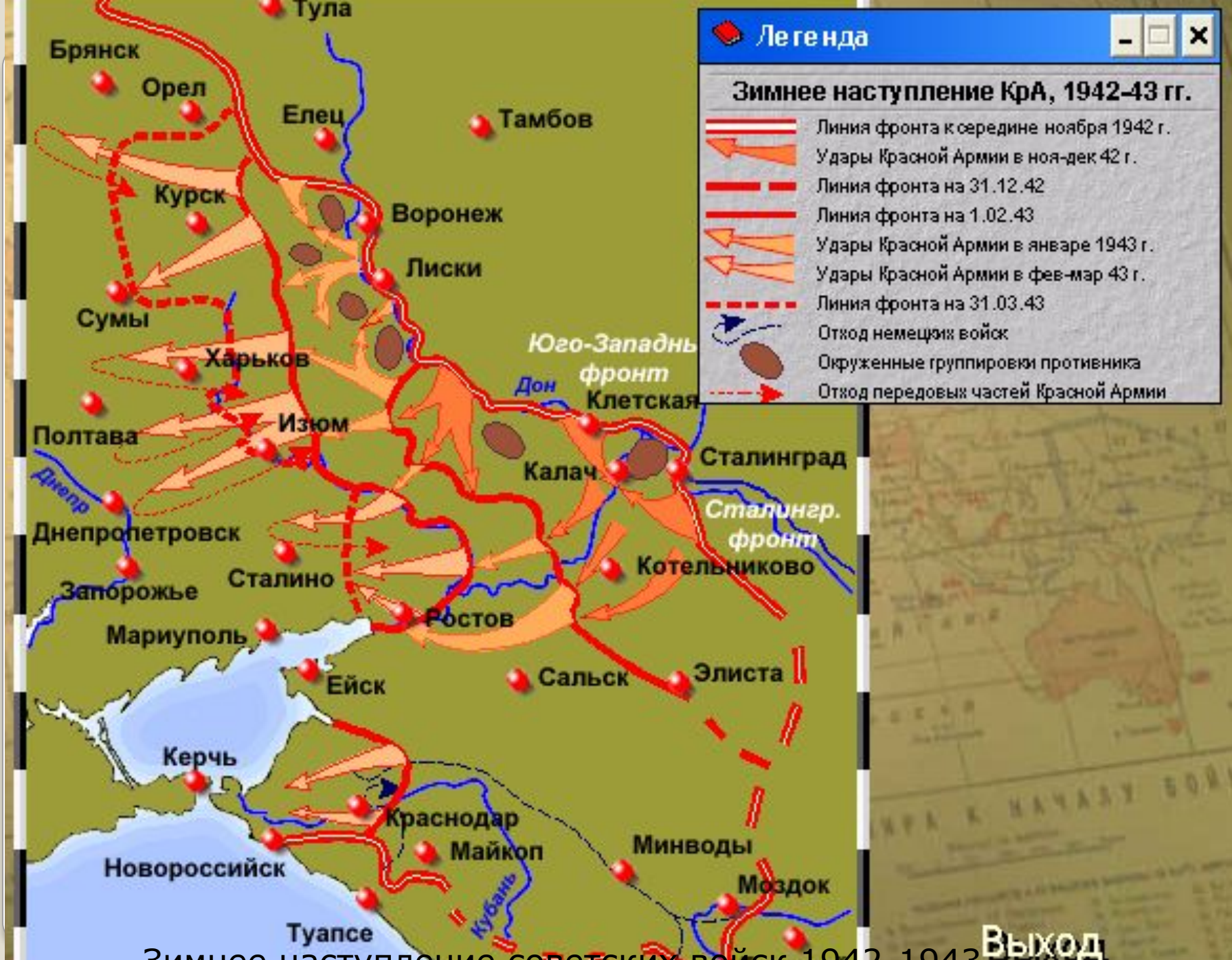
Зимнее наступление советских войск 1942-1943