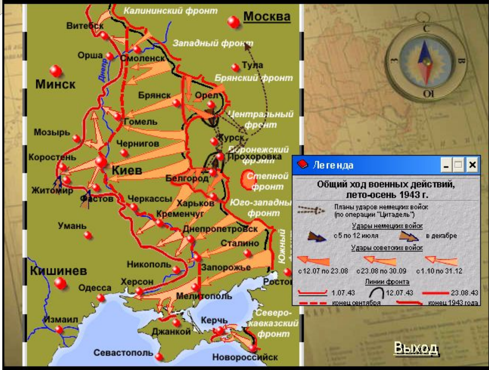
Общий ход военных действий, лето-осень 1943. Форсирование Днепра.