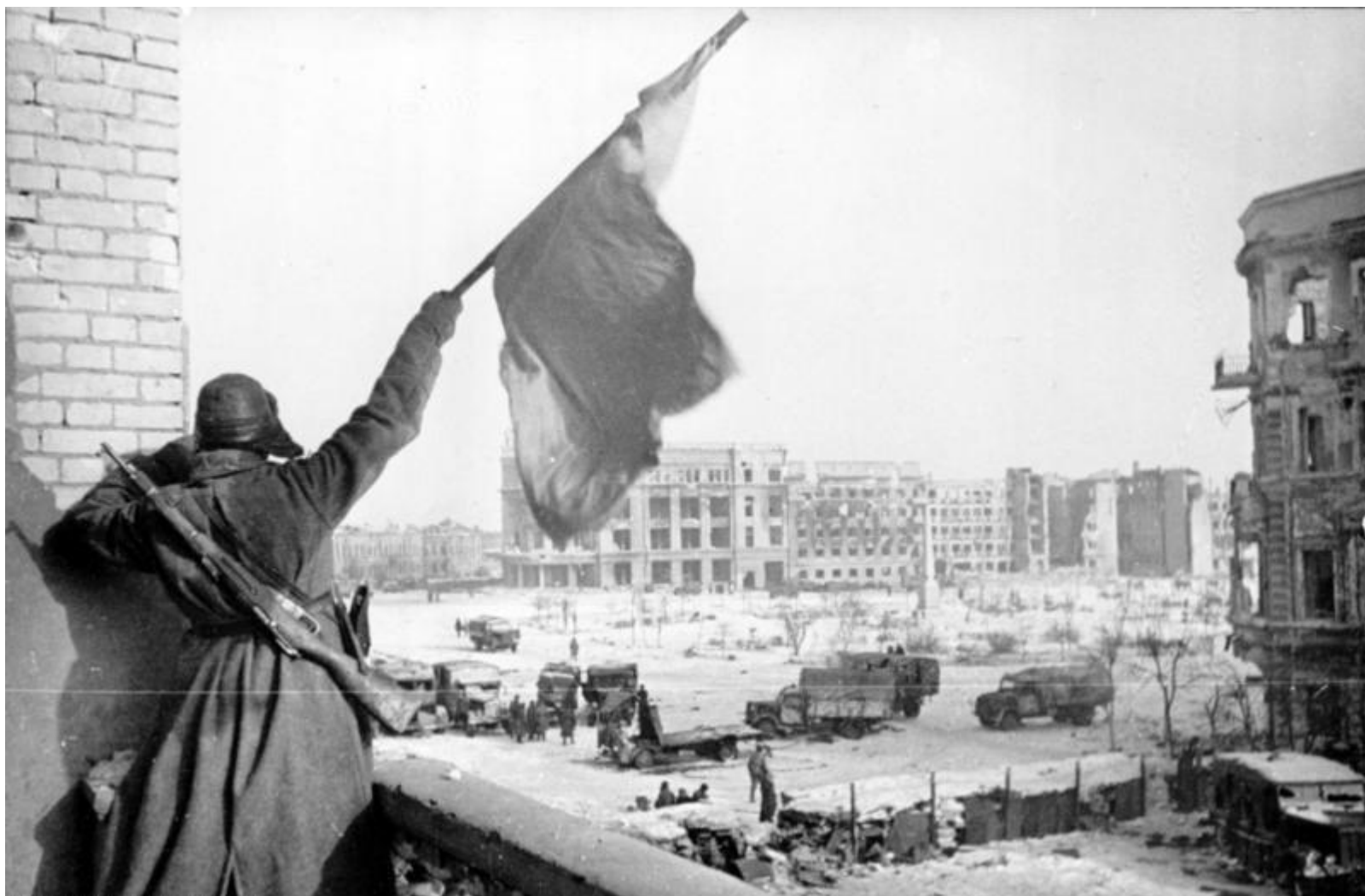
Флаг над освобожденным Сталинградом Февраль 1943