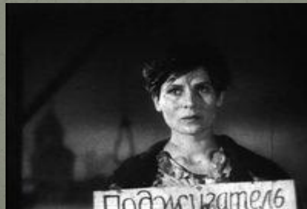
Кадры из фильма «Зоя»