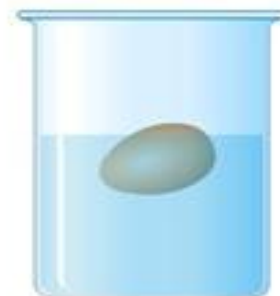
Яйцо в соленой воде

Опыт, показывающий поведение яйца в пресной и соленой воде