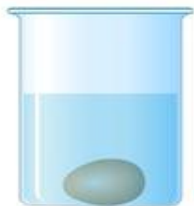
Яйцо в пресной воде