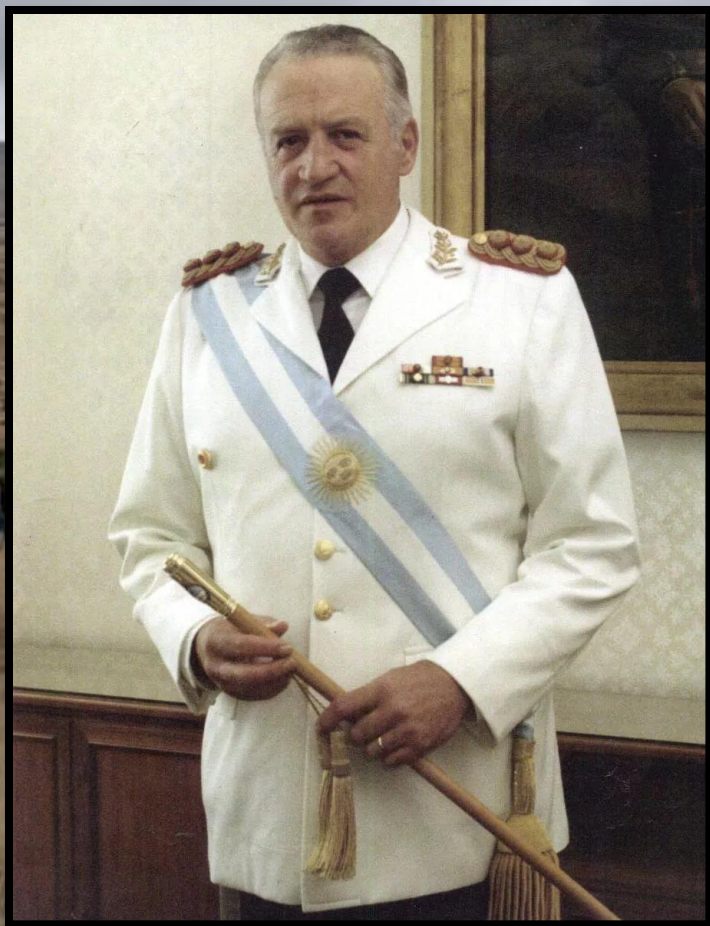
Генерал Леопольдо Гальтиери