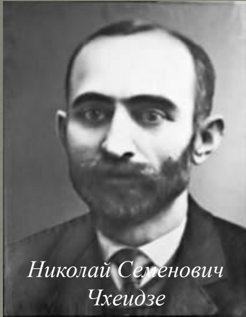
Николай Семенович Чхеидзе

Петроградский совет. Во главе меньшевик Н.С. Чхеидзе