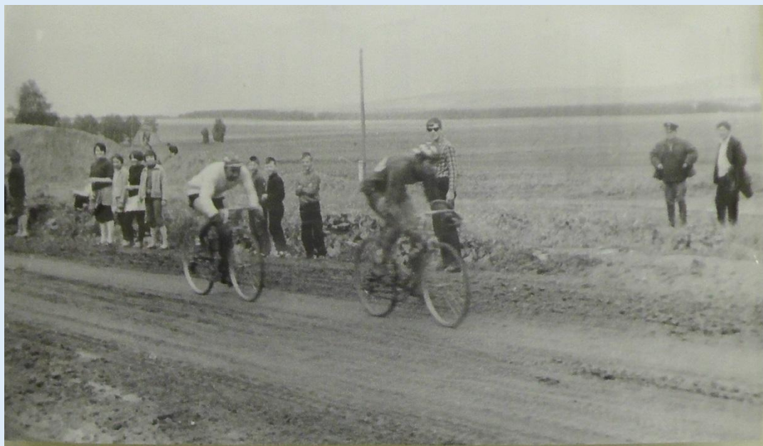
Пробег велосипедистов на приз имени Надежды Курченко на исток Камы-1974