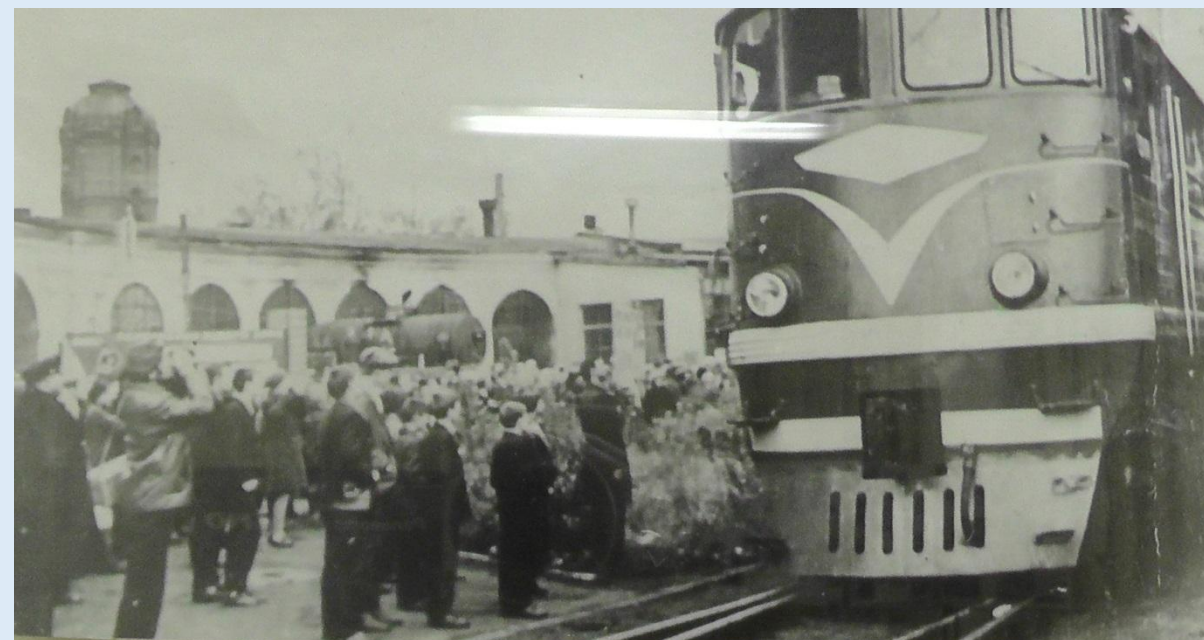
Тепловоз имени Надежды Курченко. г. Барнаул