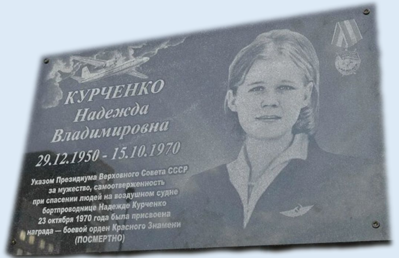
15 октября 2020 года школе № 91 г. Ижевска присвоено имя Надежды Курченко и на ее стене установлена мемориальная доска.