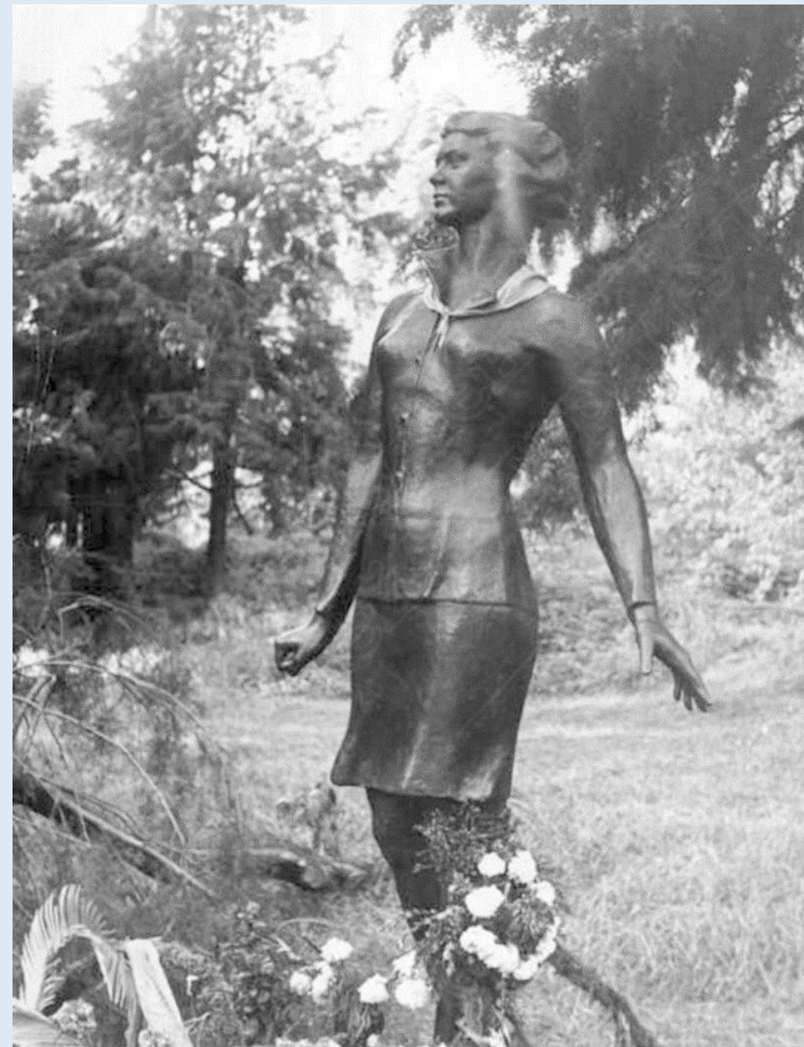
Памятник бортпроводнице Курченко Надежде Владимировне в парке г. Сухуми. 1970 г.