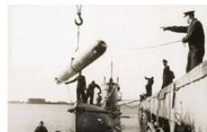
Получение торпеды на «Щ-406» (1941)