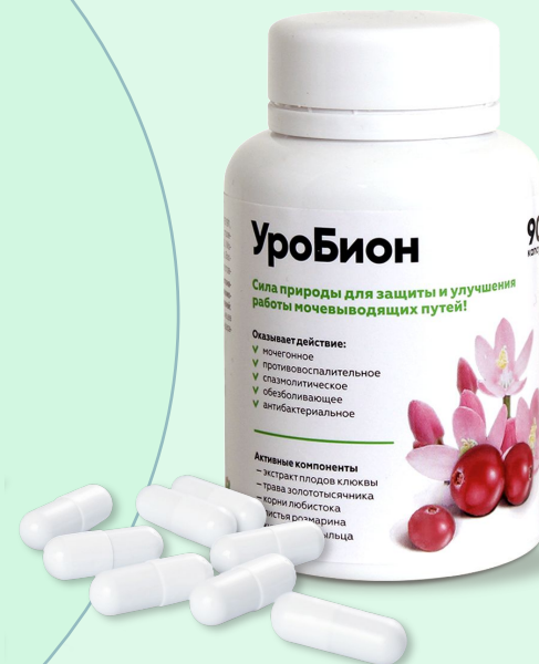
Формат выпуска 400 мг Капсулы в банке № 90