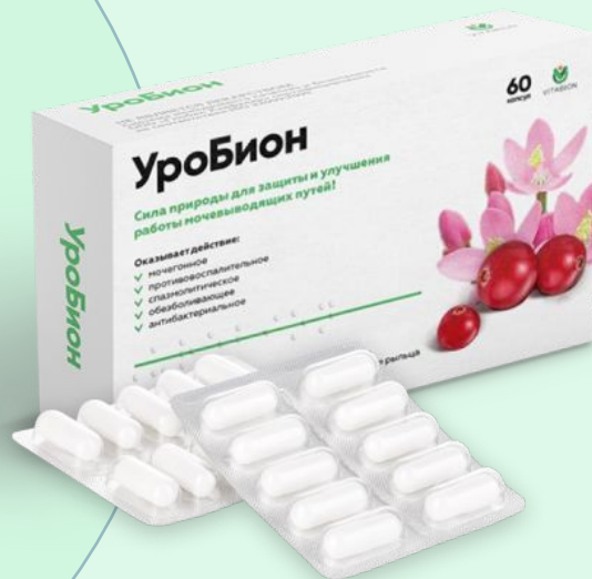
Формат выпуска 400 мг Капсулы блистером № 60