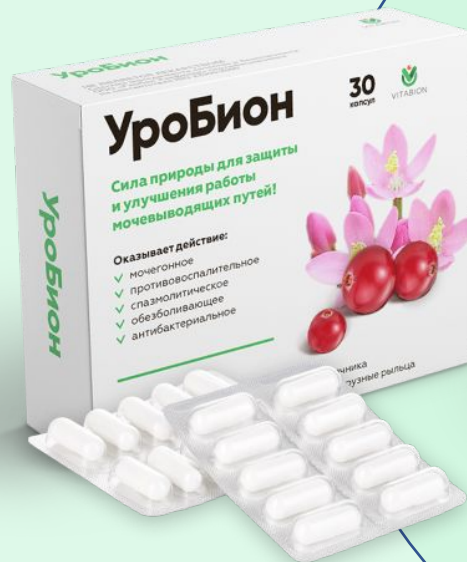
Формат выпуска 400 мг Капсулы блистером № 30