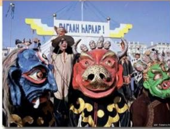
Российские буддисты празднуют Белый месяц в Иркутске

У бурят во время Белого месяца было принято окуривать дымом и кропить освящённой водой дом членов семьи и домашний скот. В этот праздник люди желают друг другу счастья и добра, поссорившиеся обязательно ищут примирения до наступления Нового года.