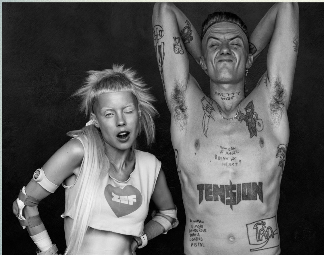
Йоланди и Ниндзя