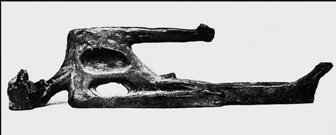
Скульптура «мертвый солдат»