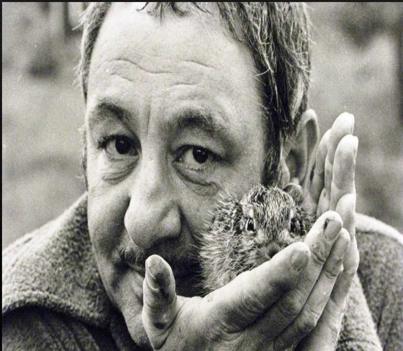
Эрнст Иосифович Неизвестный