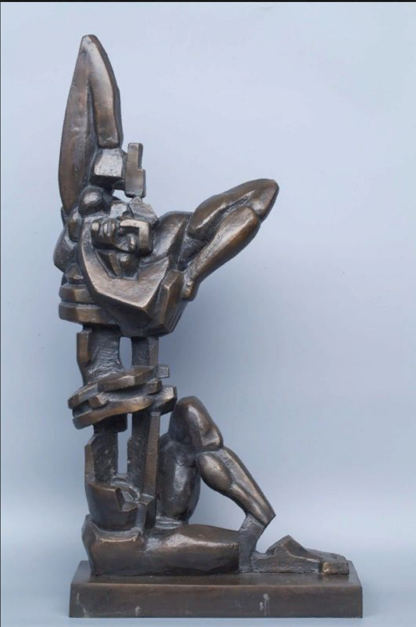
Скульптура «самоубийство» 1958г