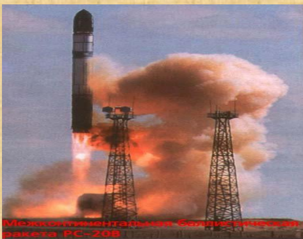
Межконтинентальная баллистическая ракета РС-20В