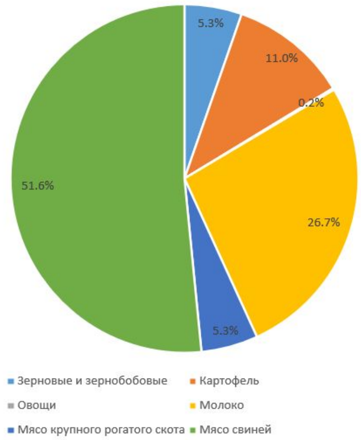
Структура стоимости продукции, %