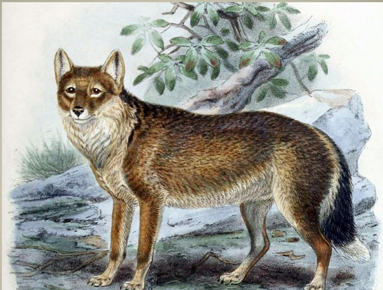
Фолклендская лисица (фолклендский волк)