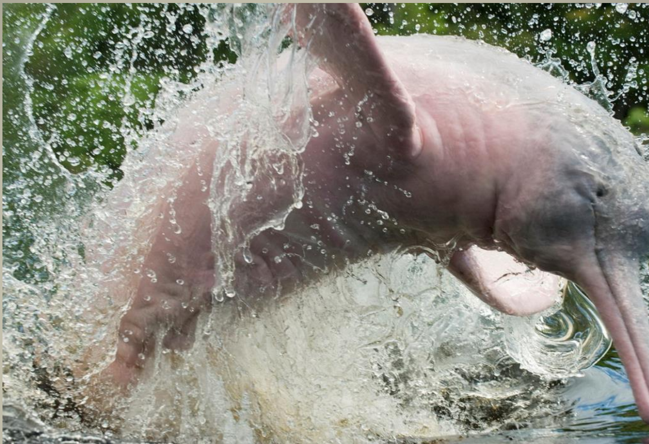
Китайский речной дельфин