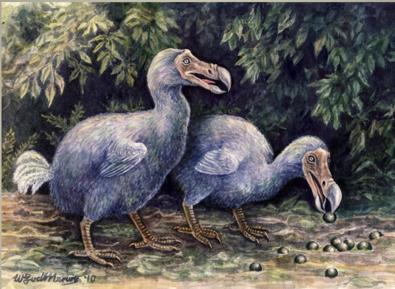
Додо (маврикийский дронг)