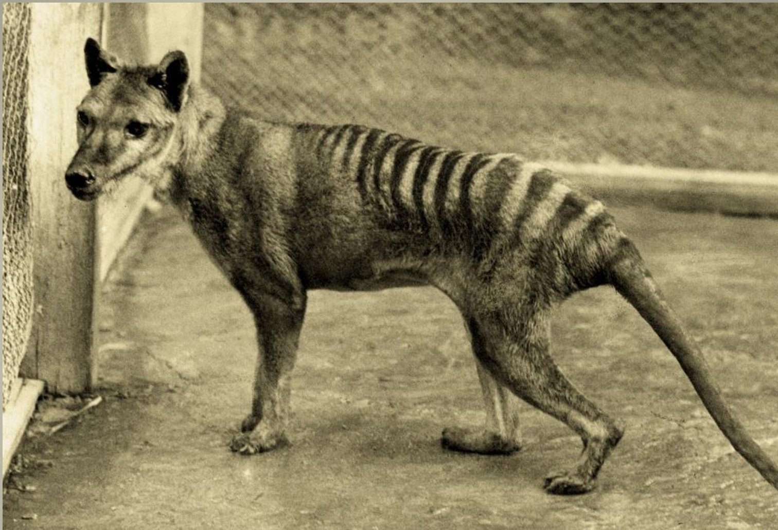
Тасманийский волк (тилацин)