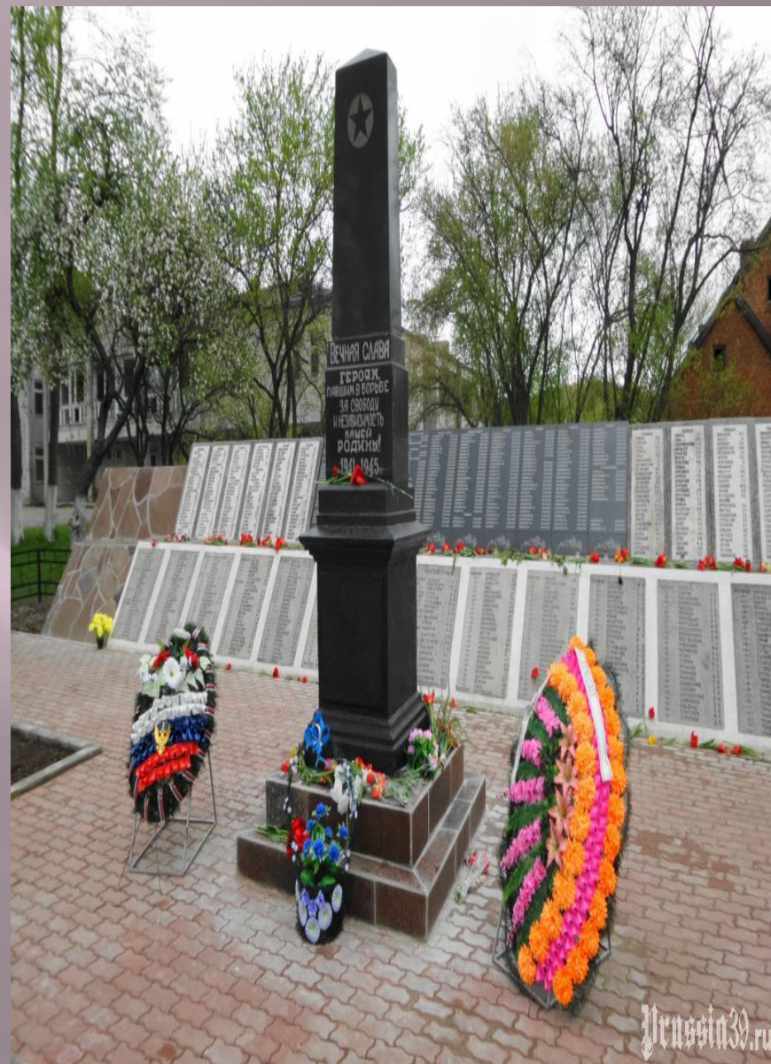
Братская могила в с. Калинино