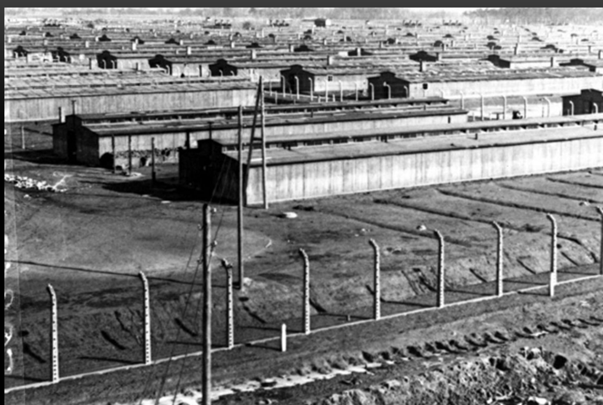
БАРАКИ КОНЦЛАГЕРЯ ОСВЕНЦИМ.