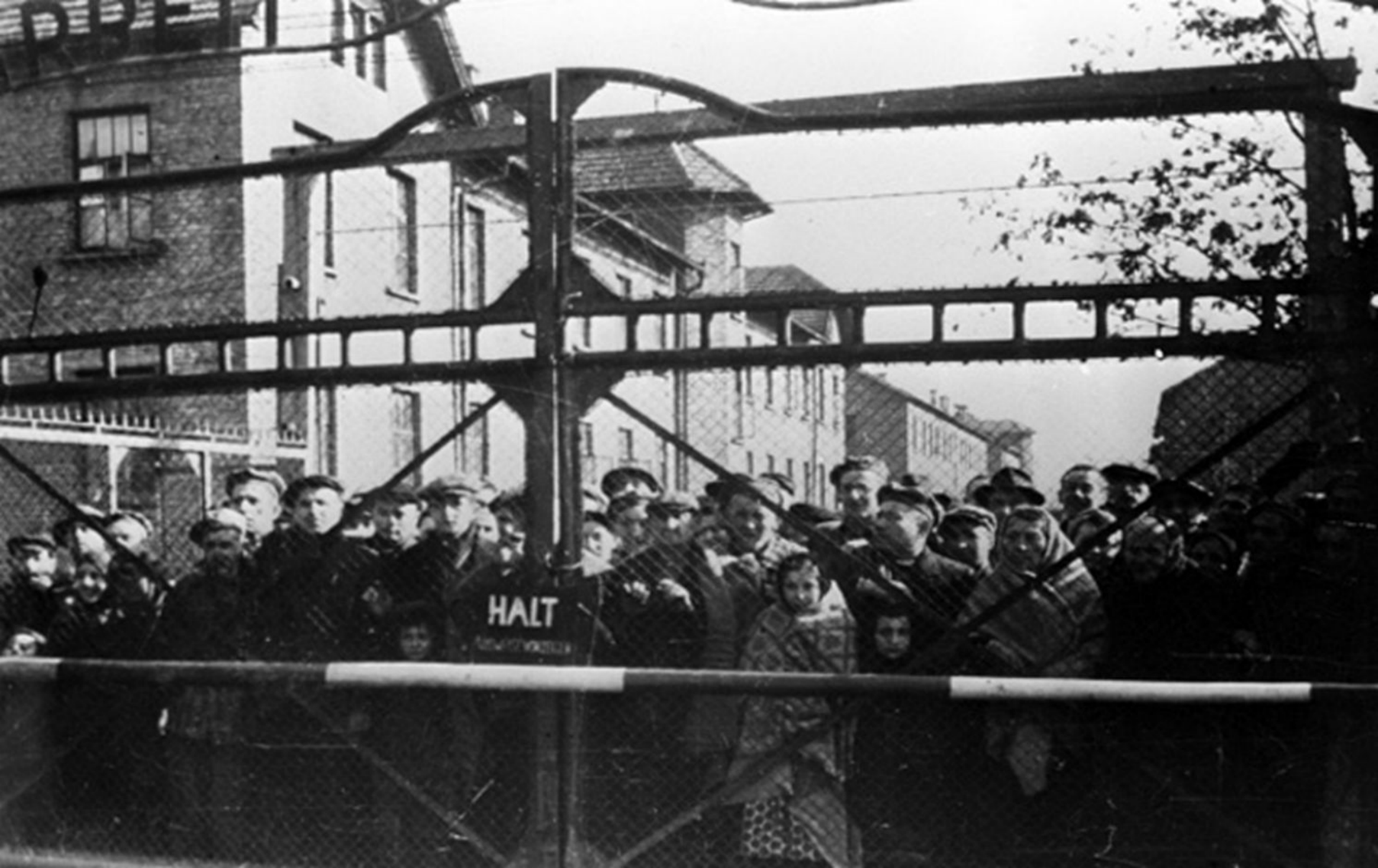
УЗНИКИ ОСВЕНЦИМА ПЕРЕД ОСВОБОЖДЕНИЕМ ЛАГЕРЯ СОВЕТСКОЙ АРМИЕЙ, ЯНВАРЬ 1945 ГОДА.