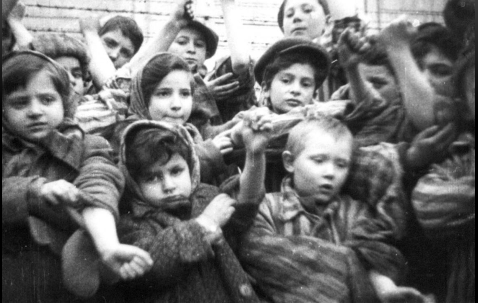
ДЕТИ-ЗАКЛЮЧЕННЫЕ КОНЦЛАГЕРЯ ОСВЕНЦИМ ПОКАЗЫВАЮТ ЛАГЕРНЫЕ НОМЕРА НА РУКАХ