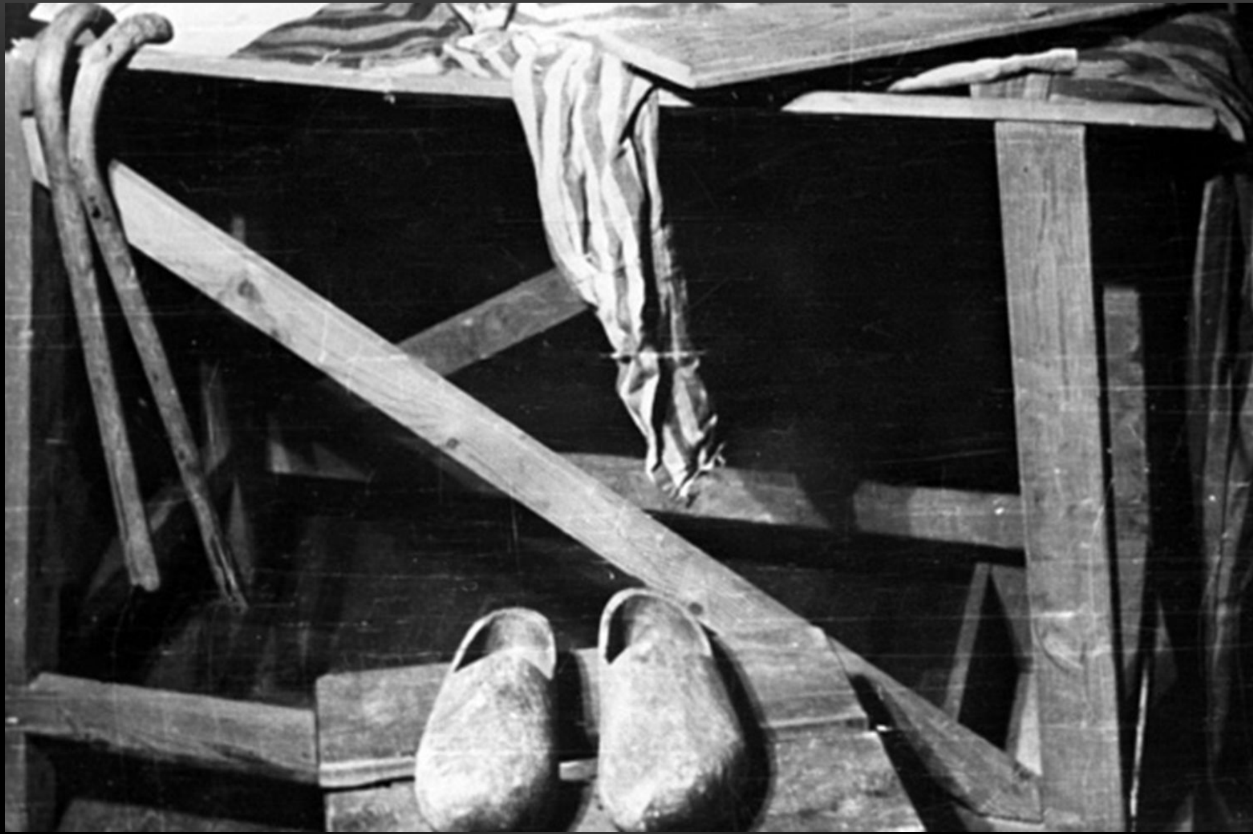
ОСВЕНЦИМ. СКАМЬЯ ДЛЯ ЭКЗЕКУЦИЙ