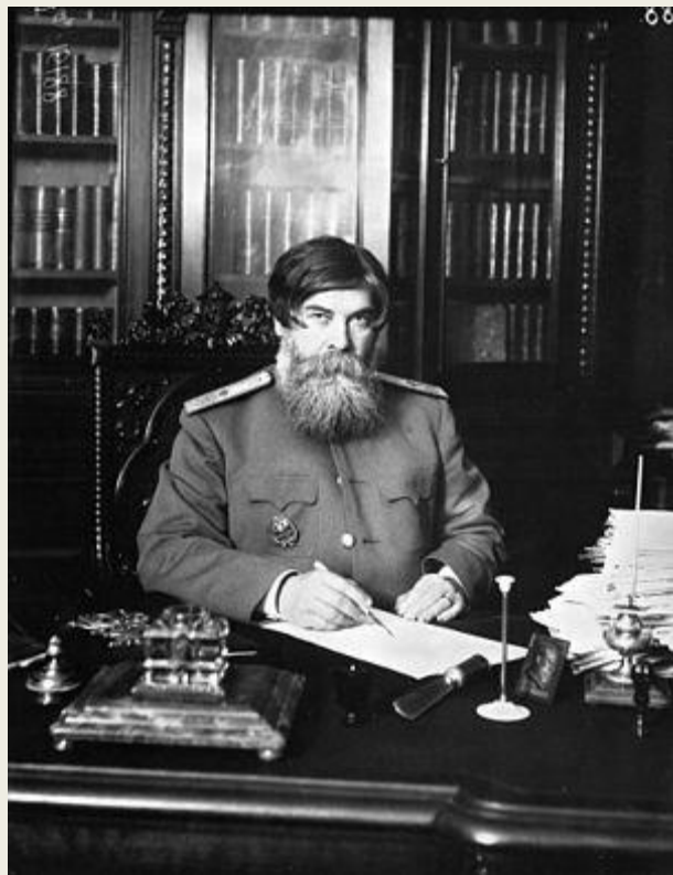
Владимир Михайлович Бехтерев