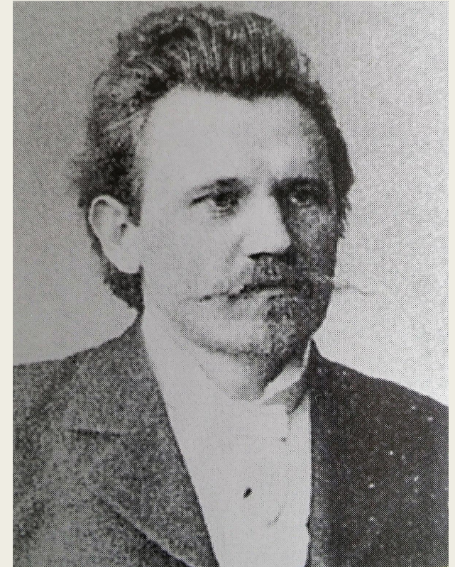
Фёдор Егорович Рыбаков

Таким образом, к 20-м гг. XX в. начала формироваться новая область знаний - экспериментальная психопатология.