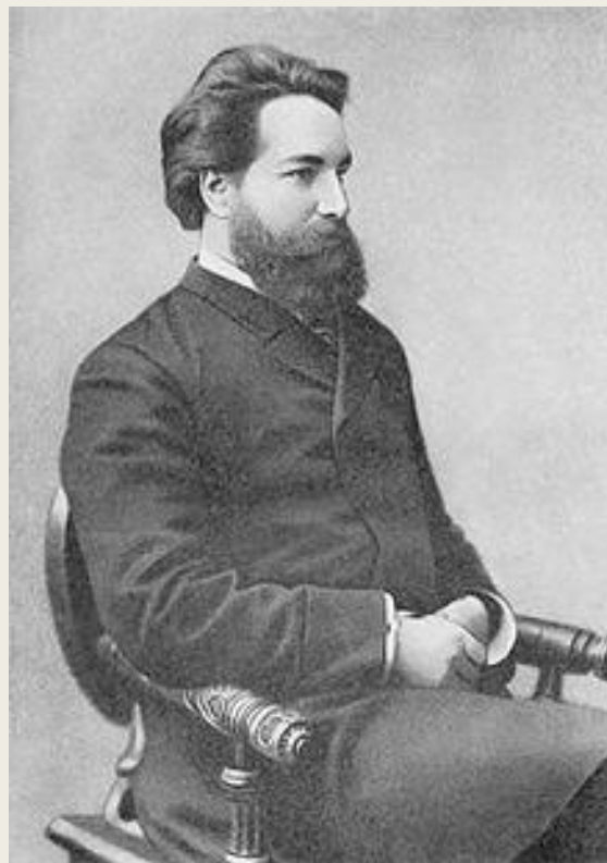
Сергей Сергеевич Корсаков