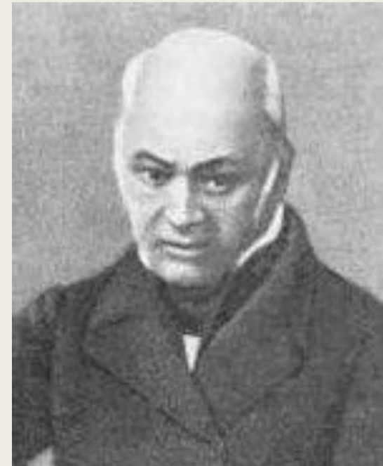
Василий Федорович Саблер

Василий Федорович Саблер (1797—1877 гг.), главный врач московской Преображенской психиатрической больницы (Психиатрический стационар имени В. А. Гиляровского) в 1832—1871 гг. Он изменил условия содержания и лечения пациентов: были отменены цепи, ограничены смирительные средства, введена трудотерапия и т. д.