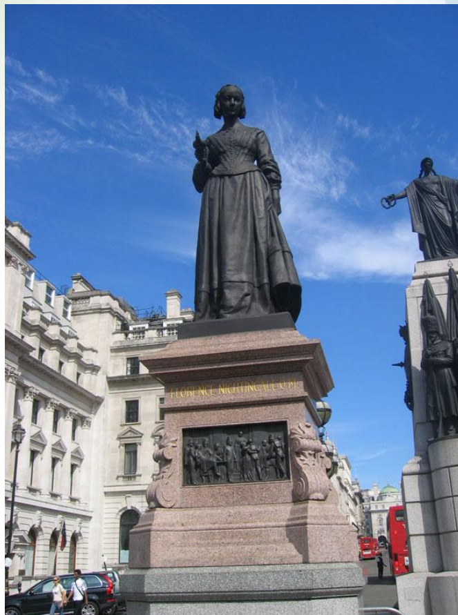
Лондон. Памятник Флоренс Найтингейл

В 1907 г. король Эдвард удостоил Флоренс высочайшей награды Британии – ордена «За заслуги»