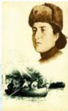
Герой Советского Союза Мария Щепетникова