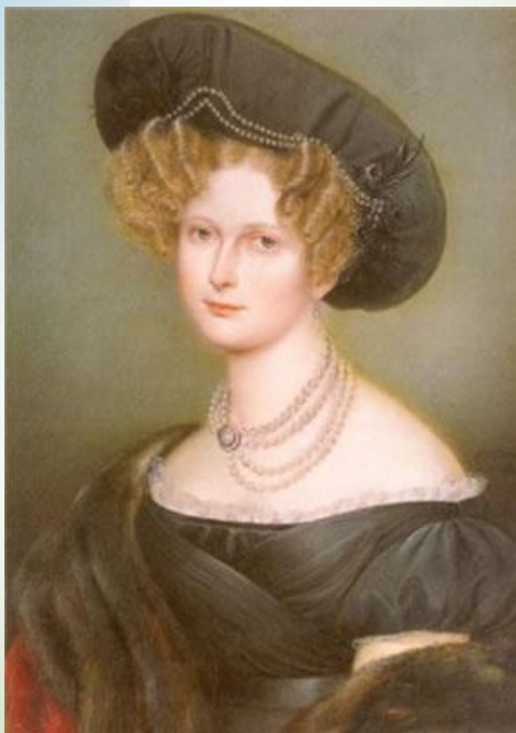
Великая княгиня Елена Павловна