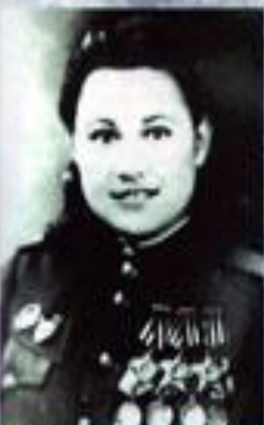
Мария Нечепухина-Походничева Капитан трех орденов «Славы»

«Сестры Флоренс» с военной пропиской 11 апреля 1945 года в Москве состоялось заседание Президиума Верховного Совета СССР, на котором были рассмотрены и утверждены 10 имен героинь Советского Союза. Среди них были и женщины-врачи, которые в годы войны проявили исключительную мужество и героизм, спасая жизни раненых солдат и офицеров. Среди них были и женщины-врачи, которые в годы войны проявили исключительную мужество и героизм, спасая жизни раненых солдат и офицеров.