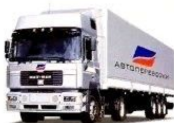
ТЯГАЧ С ПРИЦЕПОМ