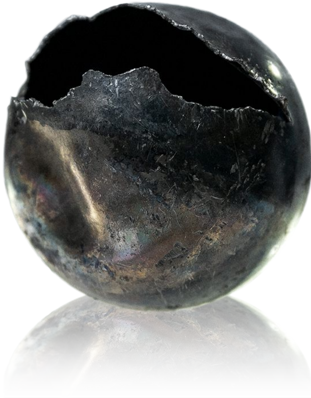
Капсула для вымпела автоматической межпланетной станции «Венера-1». 1961 год