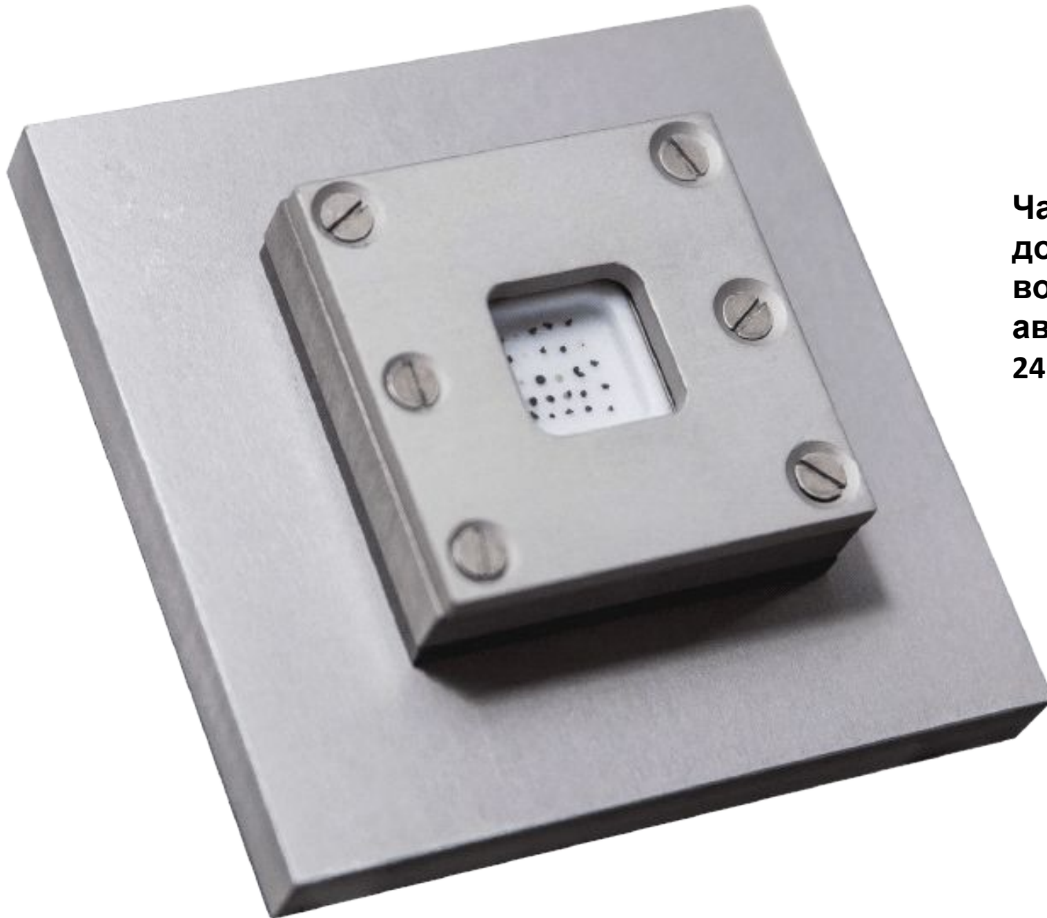
Частицы лунного грунта, доставленные на Землю возвращаемым аппаратом автоматической станции «Луна-16» 24 сентября 1970 г.