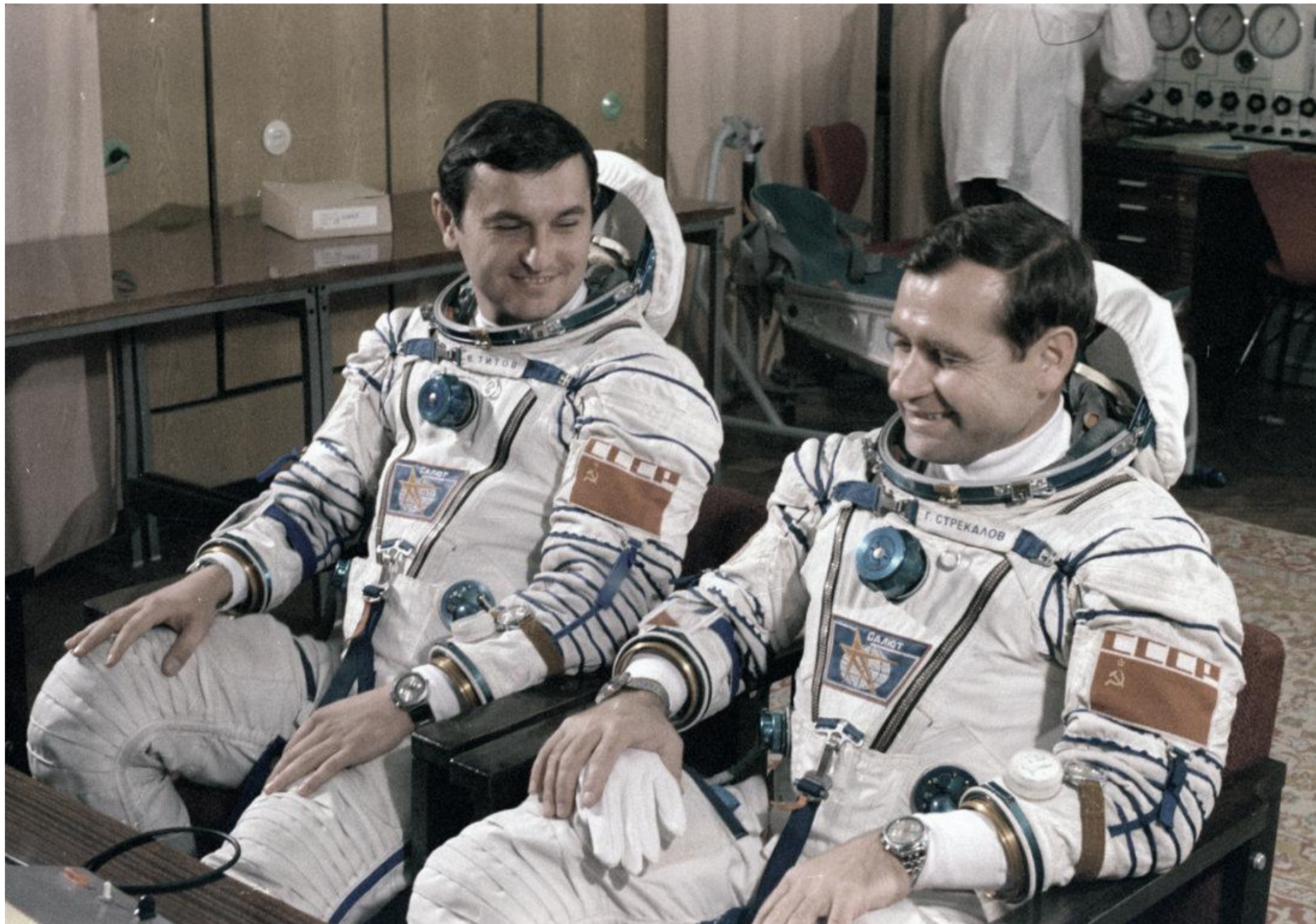
Космонавты Владимир Титов и Геннадий Стрекалов