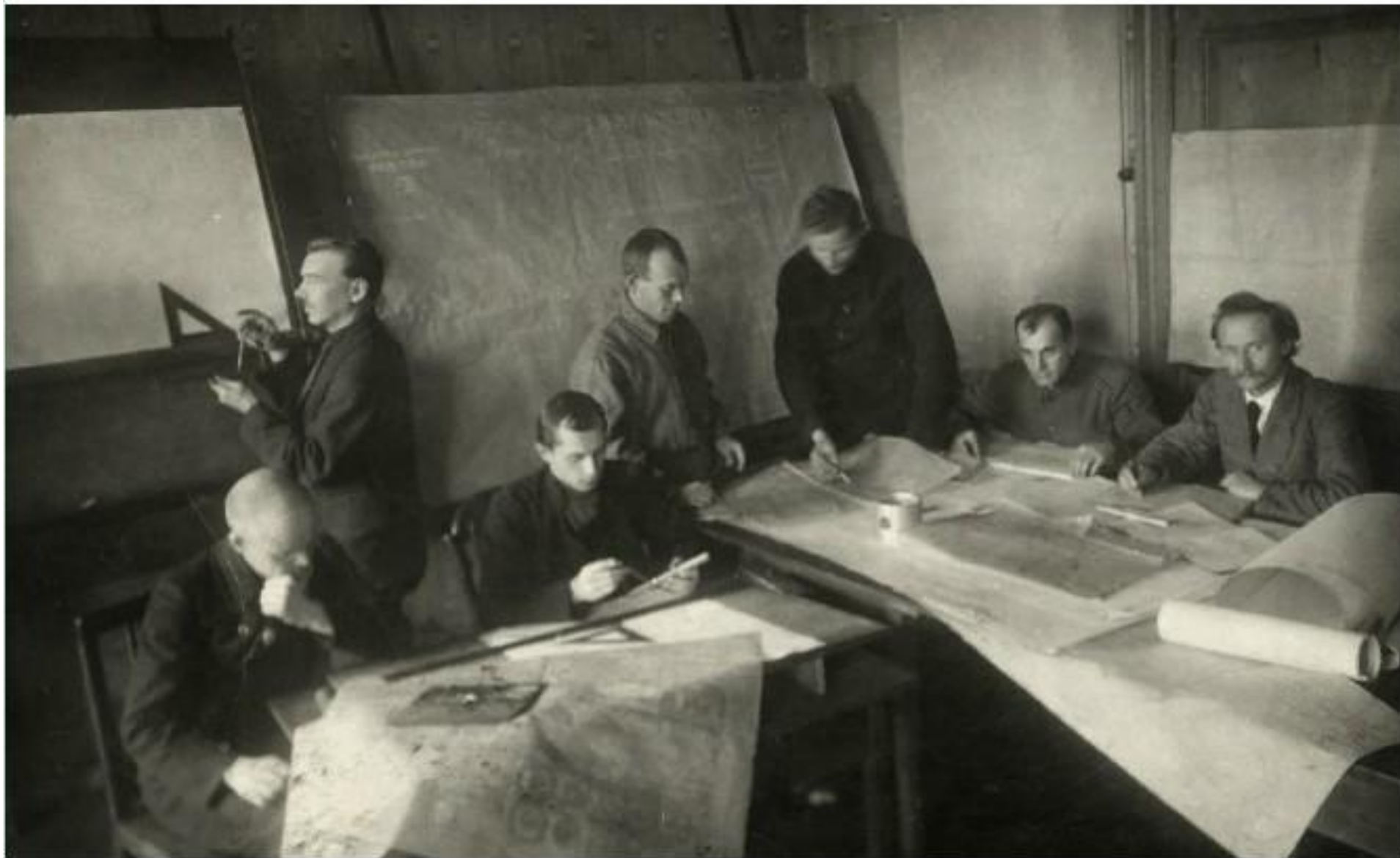
Инженеры ГИРД – Группы изучения реактивного движения 1914 г.