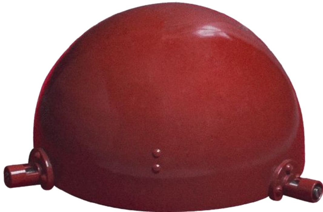
Проблесковый световой маяк корабля «Союз» для программы «Союз- Аполлон»