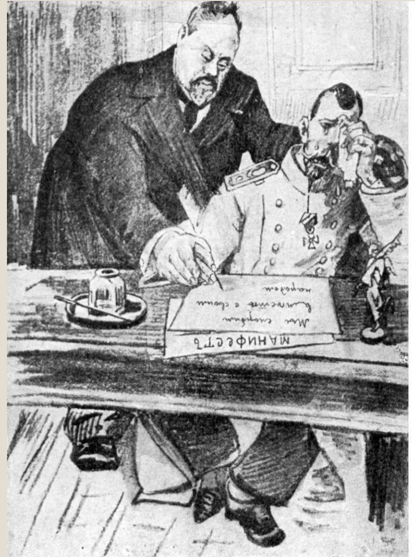
Аноним. Граф Витте и Николай II при составлении манифеста. Открытка. 1905.

17 октября 1905г. царь подписал Манифест «Об усовершенствовании государственного порядка».