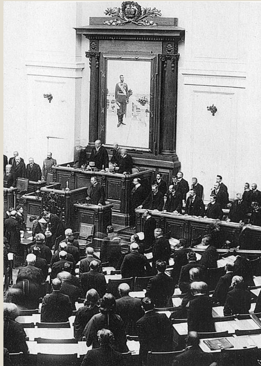
Из серии «100 лет революции 1905-1907 гг. в России».

РЕВОЛЮЦИЯ 1905-1907 ГОДОВ - ПЕРВАЯ В ИСТОРИИ БУРЖУАЗНО-ДЕМОКРАТИЧЕСКАЯ РЕВОЛЮЦИЯ, В КОТОРОЙ ПРОЛЕТАРИАТ ВЫСТУПИЛ САМОСТОЯТЕЛЬНОЙ ПОЛИТИЧЕСКОЙ СИЛОЙ, ВОЖДЕМ УГНЕТЕННЫХ МАСС, БОРЮЩИХСЯ ЗА СОЦИАЛЬНОЕ ОСВОБОЖДЕНИЕ.