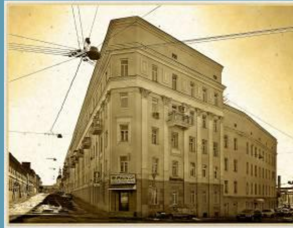
Знаменитый дом-утиуг на Хитровке