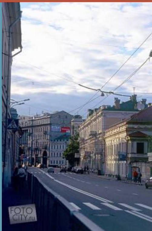
Улица Солянка сегодня