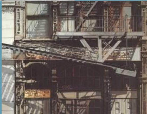
Улица Солянка в начале XX века