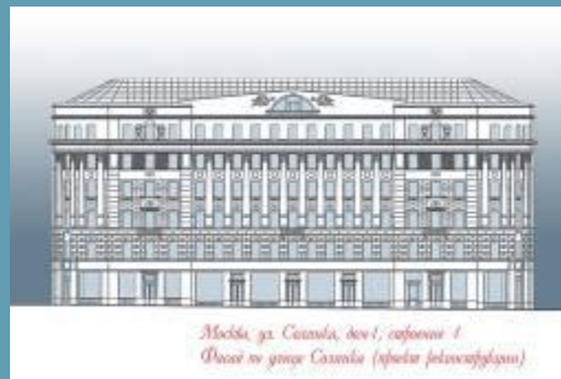
Модель гл. здания, 1901; вариант 1 Фасад со стороны Солянки (справа - фотокопировка)