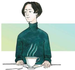
Не ставлю локти на стол