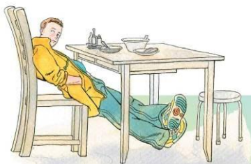
Вытягиваю ноги под столом

4. Рассмотрите рисунки. Кто поступает правильно?