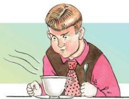
Дую на горячий чай

3. Однажды древнего восточного мудреца спросили: «У кого ты учился благовоспитанности?» — «У невоспитанных», — ответил он. Что имел в виду мудрец?