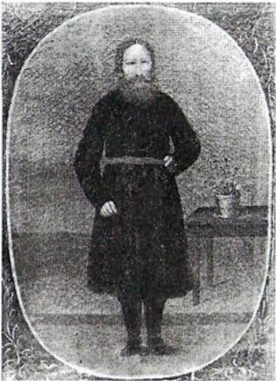
Первый поселенец-духобор. Картина неизвестного художника