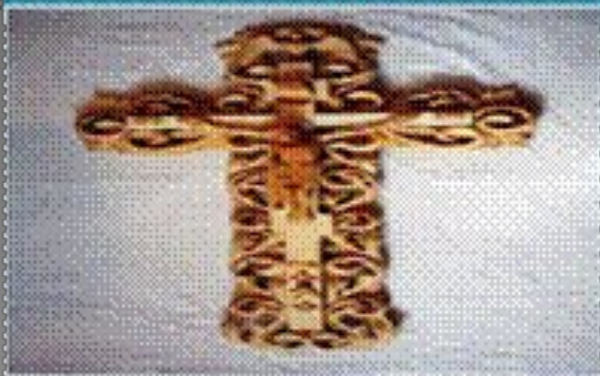
Прорезная, или ажурная