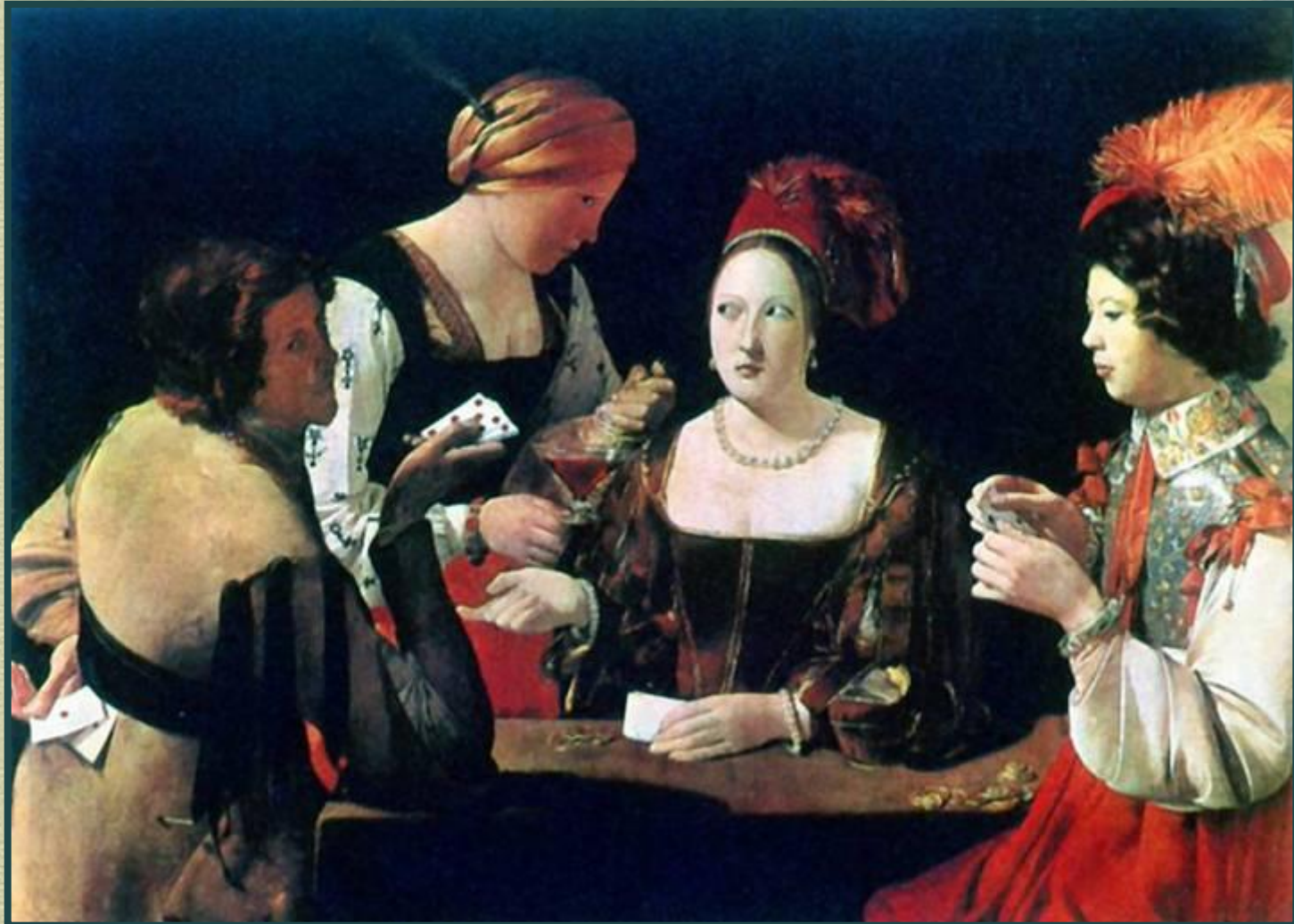
Жорж де Латур. Шулер. (ок. 1633-1640)

Развитие реалистической живописи связано с творчеством Жоржа де Латура (1593-1652)