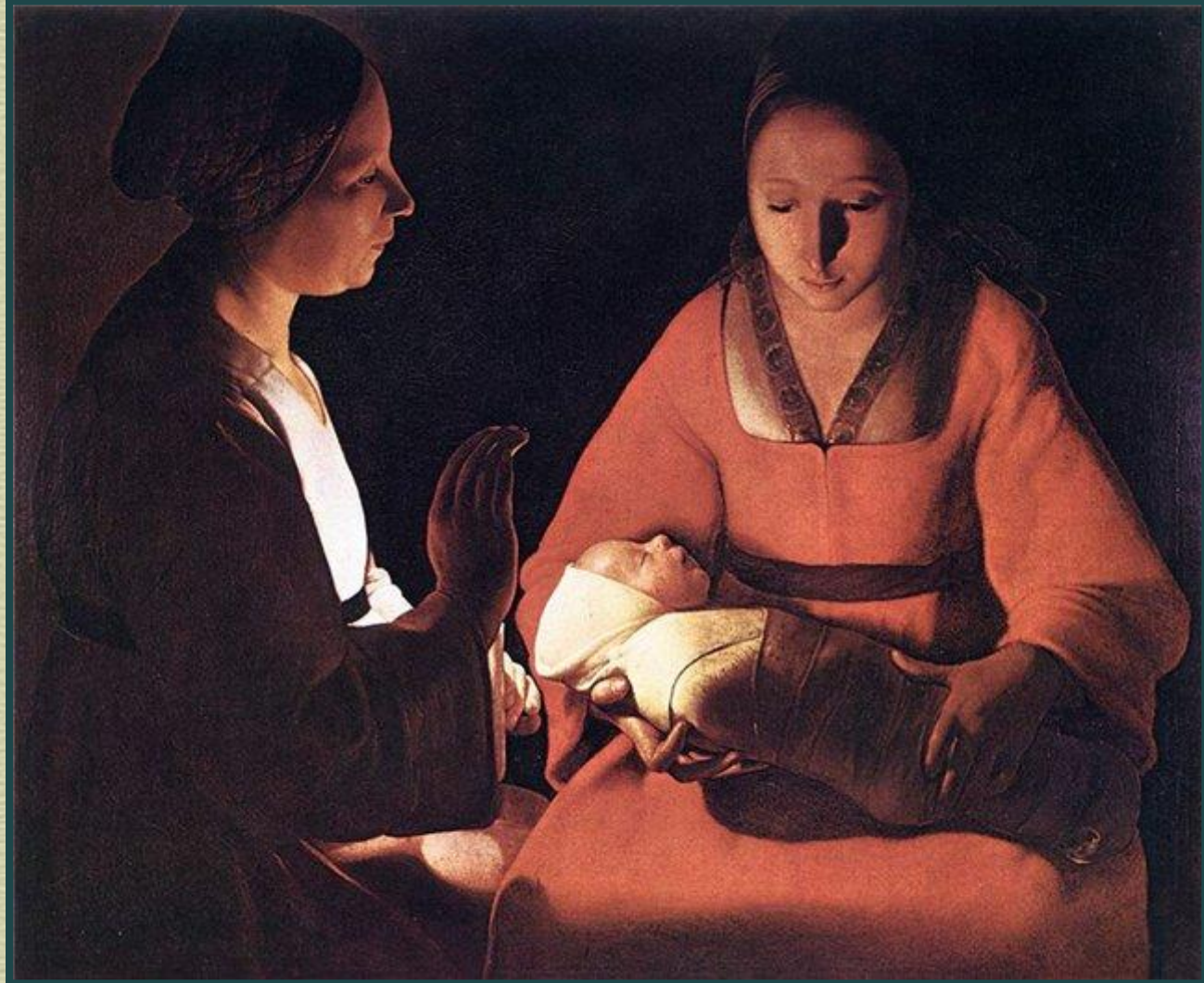
Жорж де Латур Новорожденный (1640-1650)

Сюжеты картин Латура связаны с разными проявлениями человеческого бытия, в них соединяются все возрасты человека, и особое значение играет свет как божественное провидение.