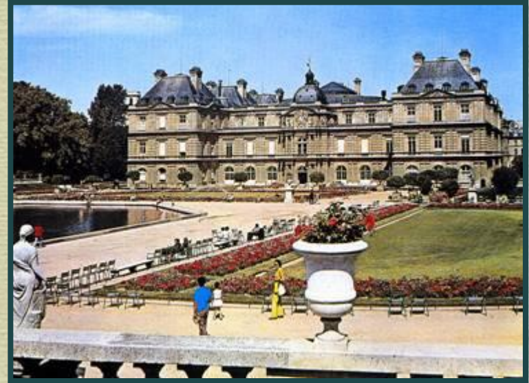
Саломон де Брос Люксембургский дворец в Париже 1615-1621