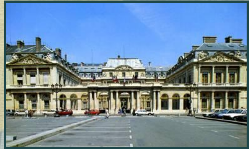
Жак Лемерсье Пале-Рояль Париж 1624-1645