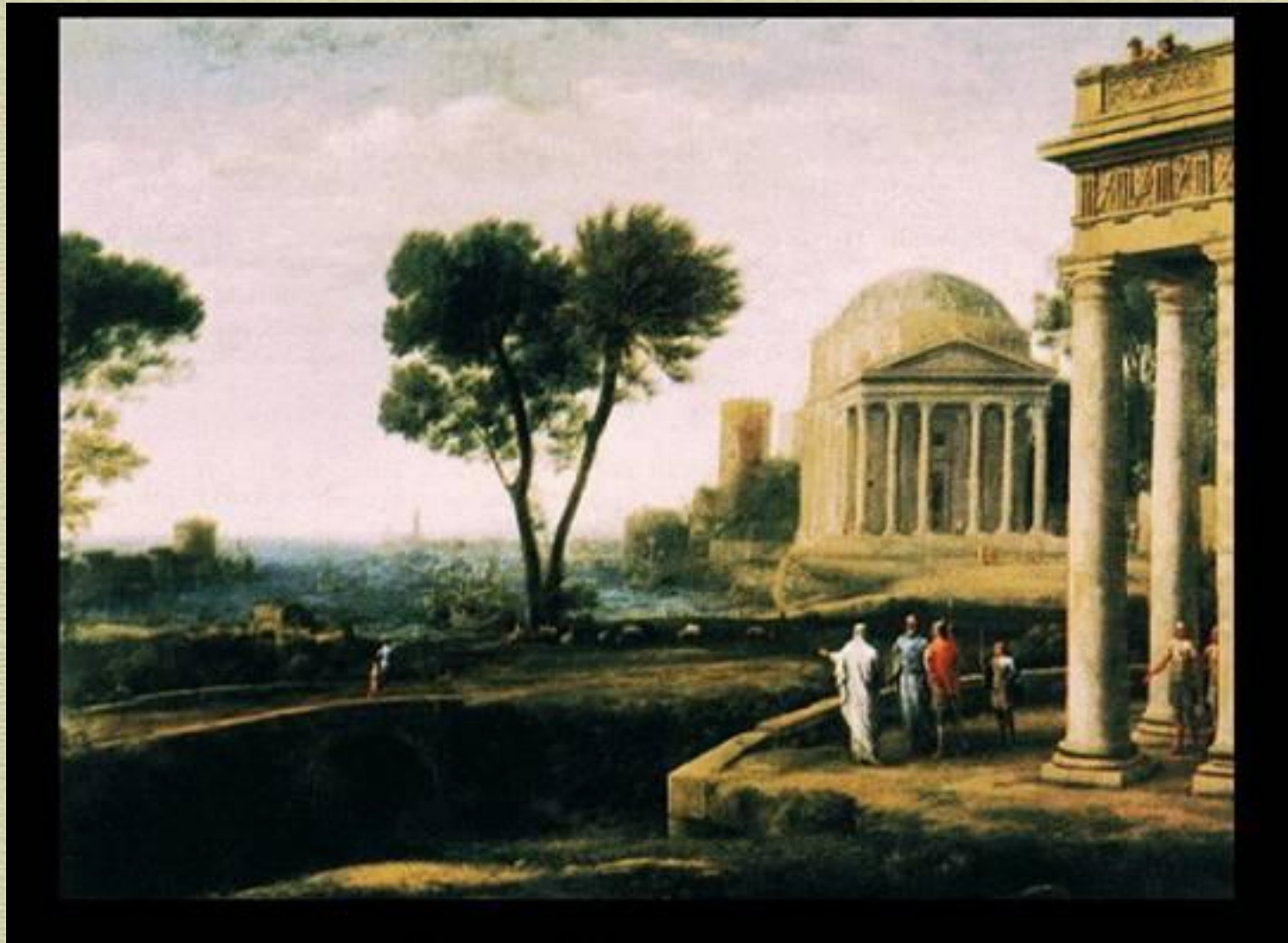
Пейзаж с Энеем на Делосе (1672)

Классический пейзаж получил развитие у Клода Лоррена (1600-1682).