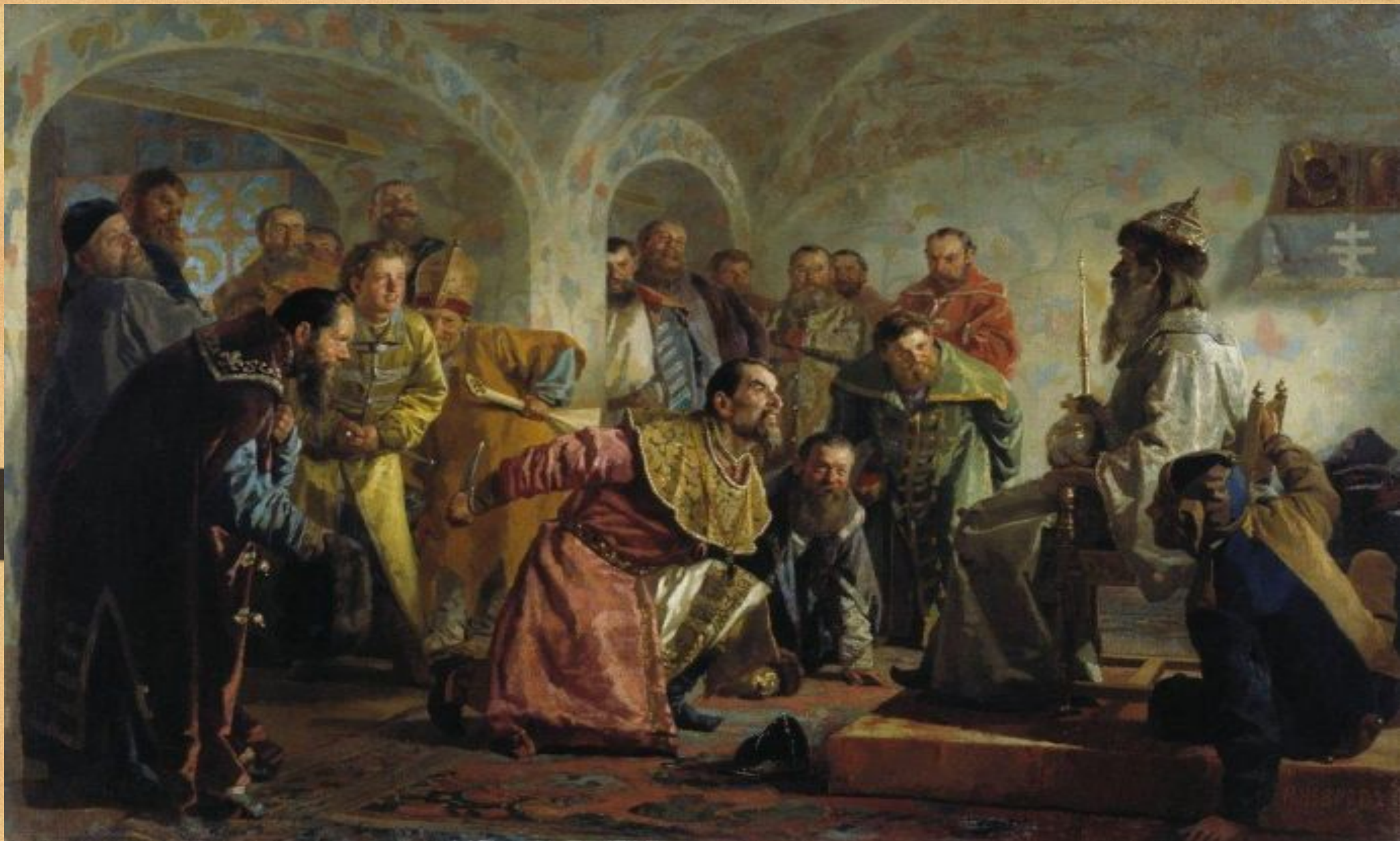
Опричный суд над «изменником».