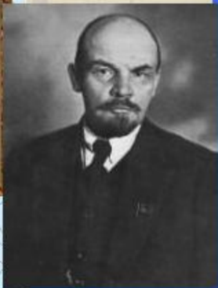
Ленин Владимир Ильич 1870 - 1924