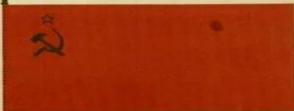
ГОСУДАРСТВЕННЫЙ ФЛАГ СОЮЗА СОВЕТСКИХ СОЦИАЛИСТИЧЕСКИХ РЕСПУБЛИК.

утвержденный 2-ой сессией Центрального Исполнительного Комитета Союза Совет- ских Социалистических Республик 6-го июля 1922 года в Москве.