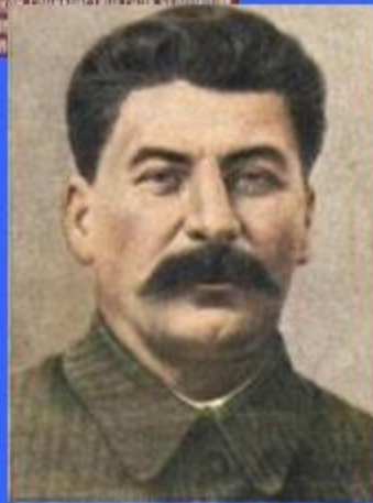
Сталин Иосиф Виссарионович 1879 - 1953