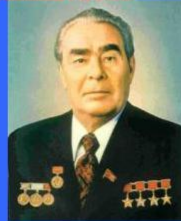
Брежнев Леонид Ильич 1906- 1982