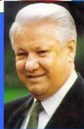
Ельцин Борис Николаевич 1931 -2007