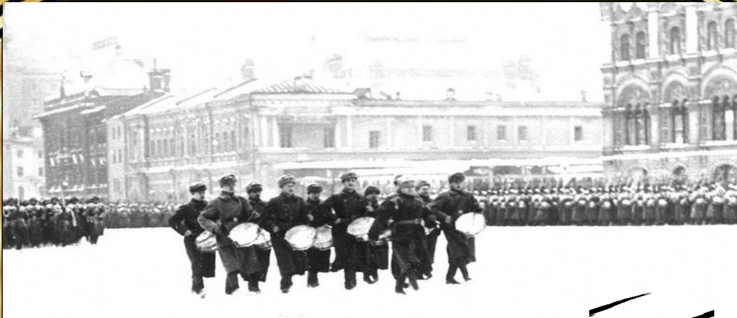
ВОЕННЫЙ ПАРАД НА КРАСНОЙ ПЛОЩАДИ