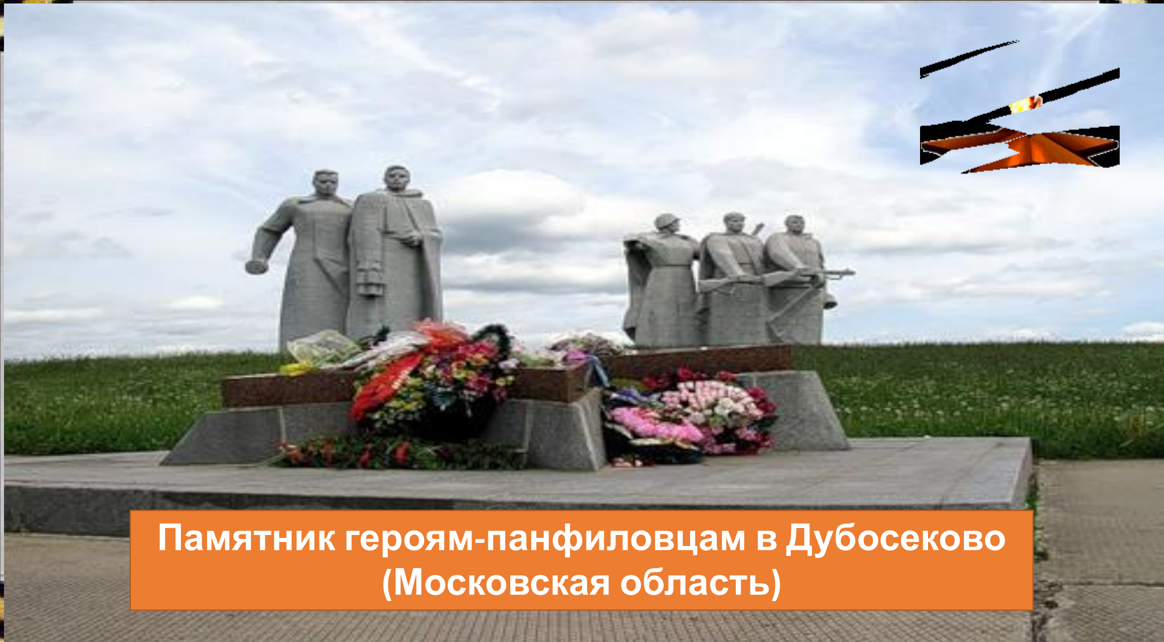
Памятник героям-панфиловцам в Дубосеково (Московская область)