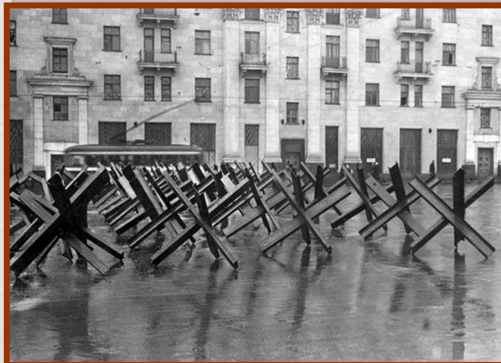
Противотанковые заграждения на улицах Москвы (ежи)