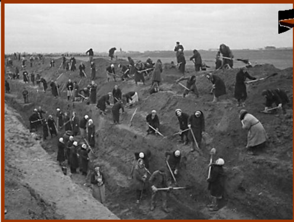
Строительство оборонительных укреплений на подступах к Москве