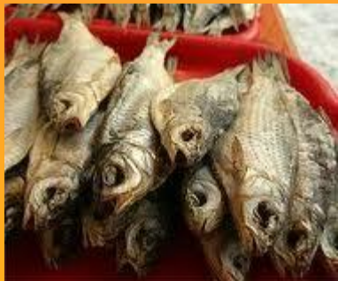
Сушёная рыба (Исландия)