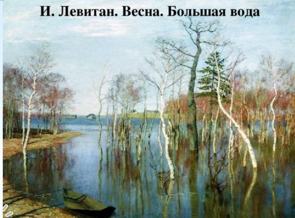
И. Левитан. Весна. Большая вода