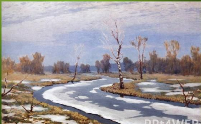
А.И. Куинджи «Ранняя весна»