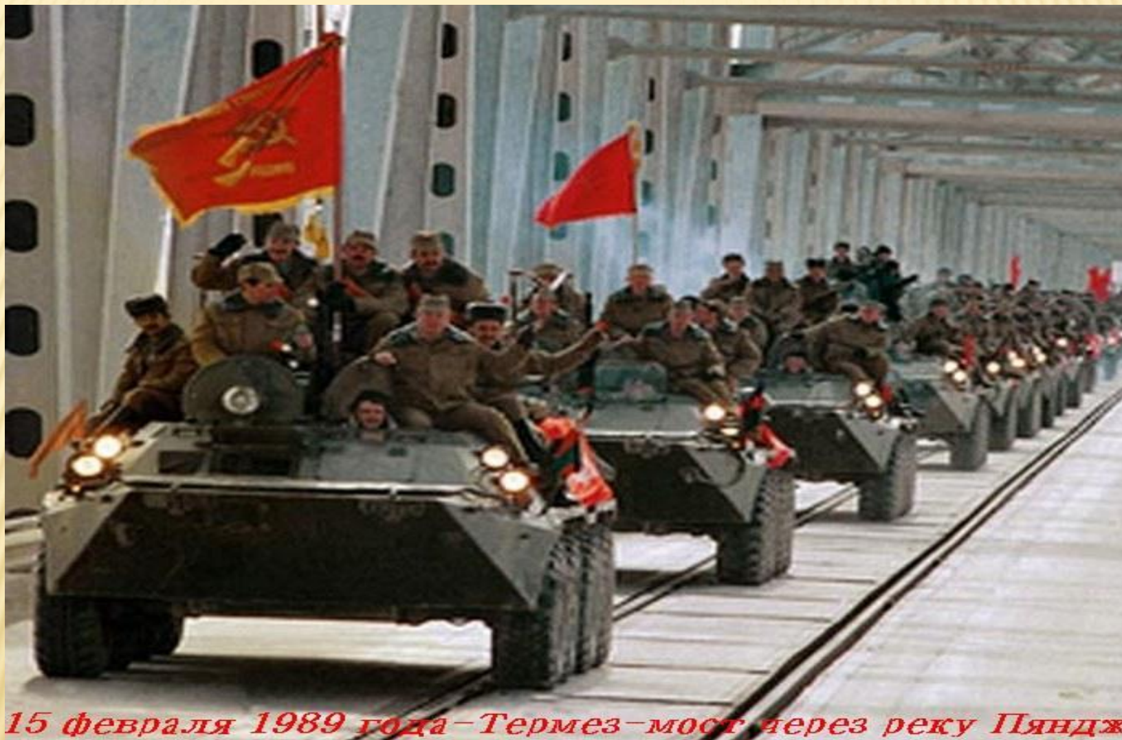
15 февраля 1989 года - Термез - мост через реку Пяндж