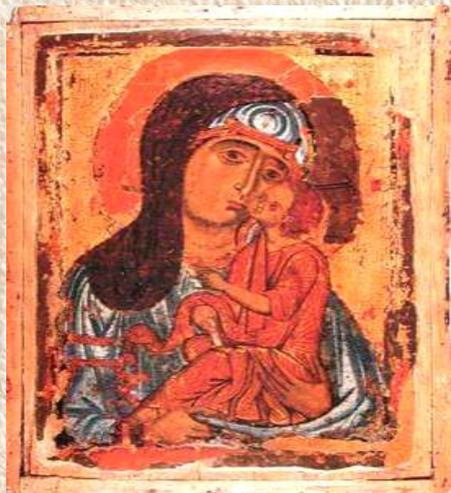
Икона XII века из Успенского собора