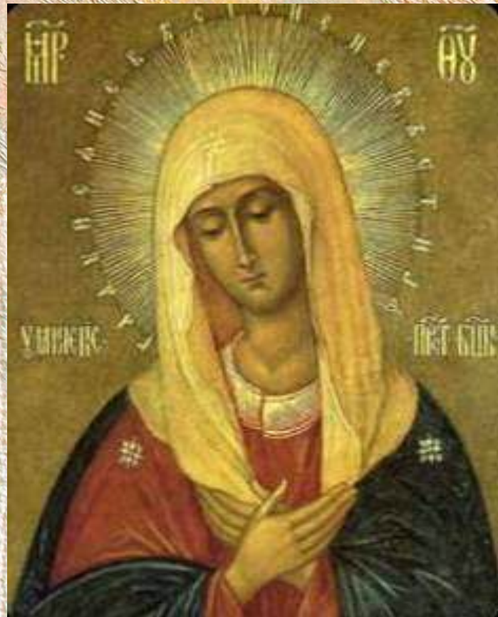
Умиление «Всех Радостей Радость»