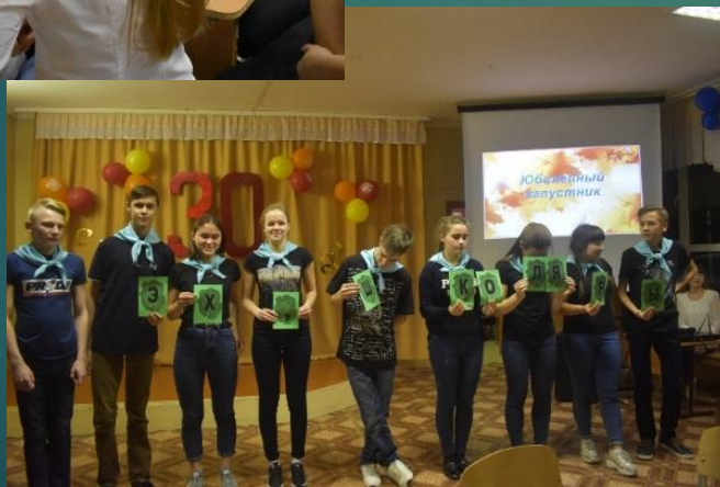
«Юбилейный капустник» 10 классы