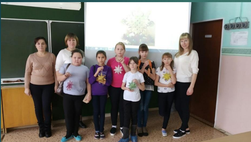
5 классы- «Рождественские встречи»