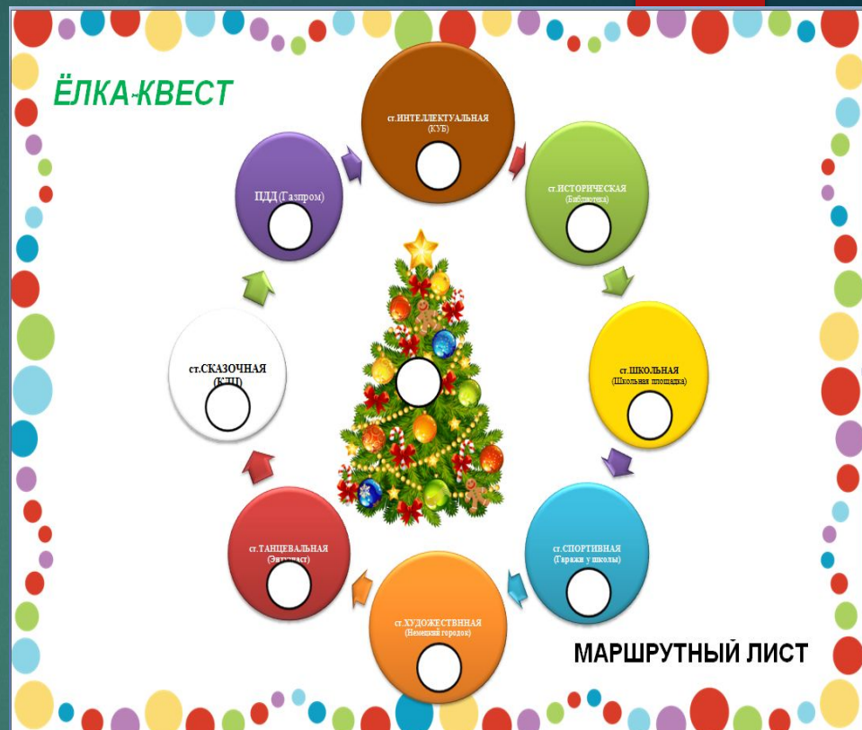
6 классы – Юбилейный квест