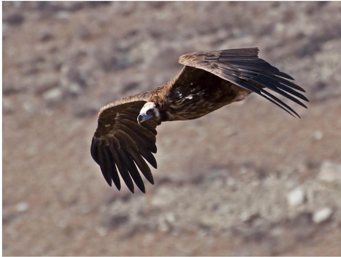
Чёрный гриф, или бурый гриф