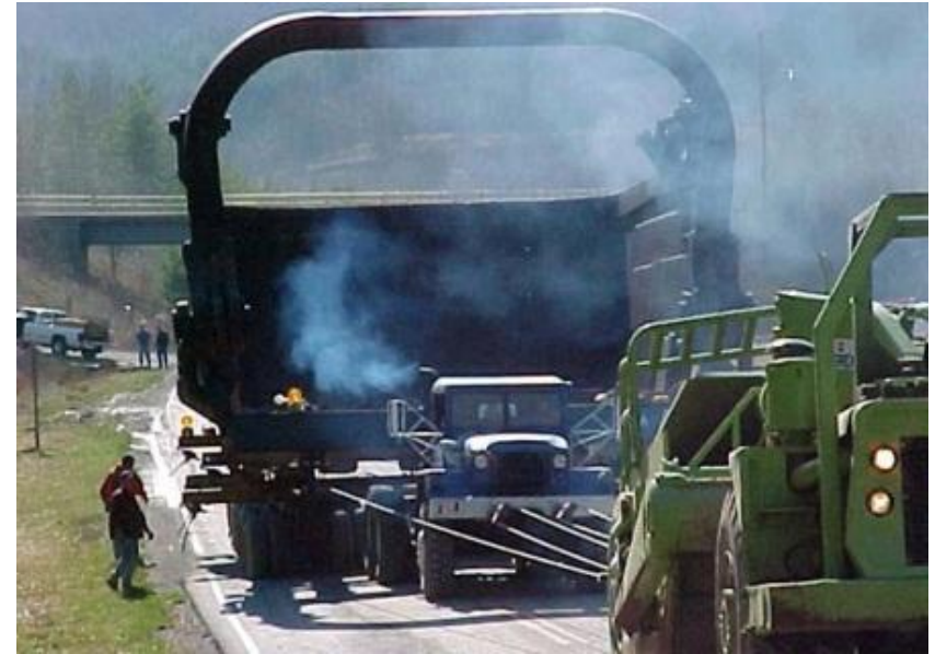
Завоз карьерного оборудования