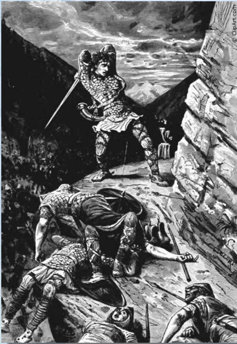
Прощання Роланда з Дюрандалем

Роланд – головний герой епосу, граф, небіж короля, пасинок Ганелона і просто сміливий рицар. Він вірно служив королю.