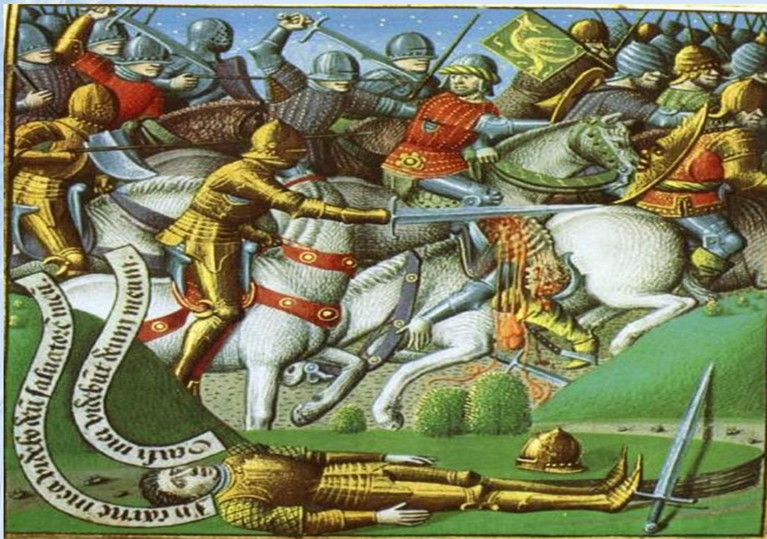
Ронсевальська битва. 15 серпня 778 г.