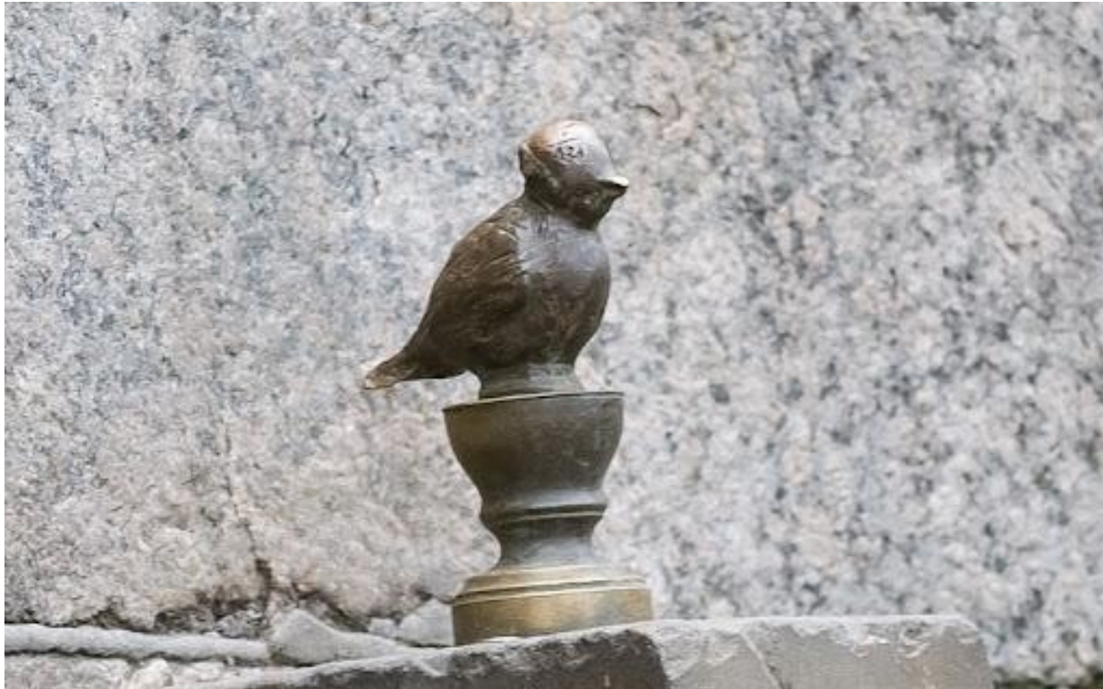
Памятник чижик-пыжик, герою питерского фольклора