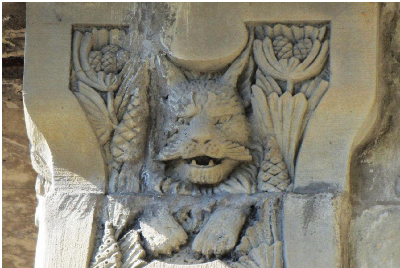
Кошка на фасаде Дома Лидваль, Каменноостровский проспект, 1-3