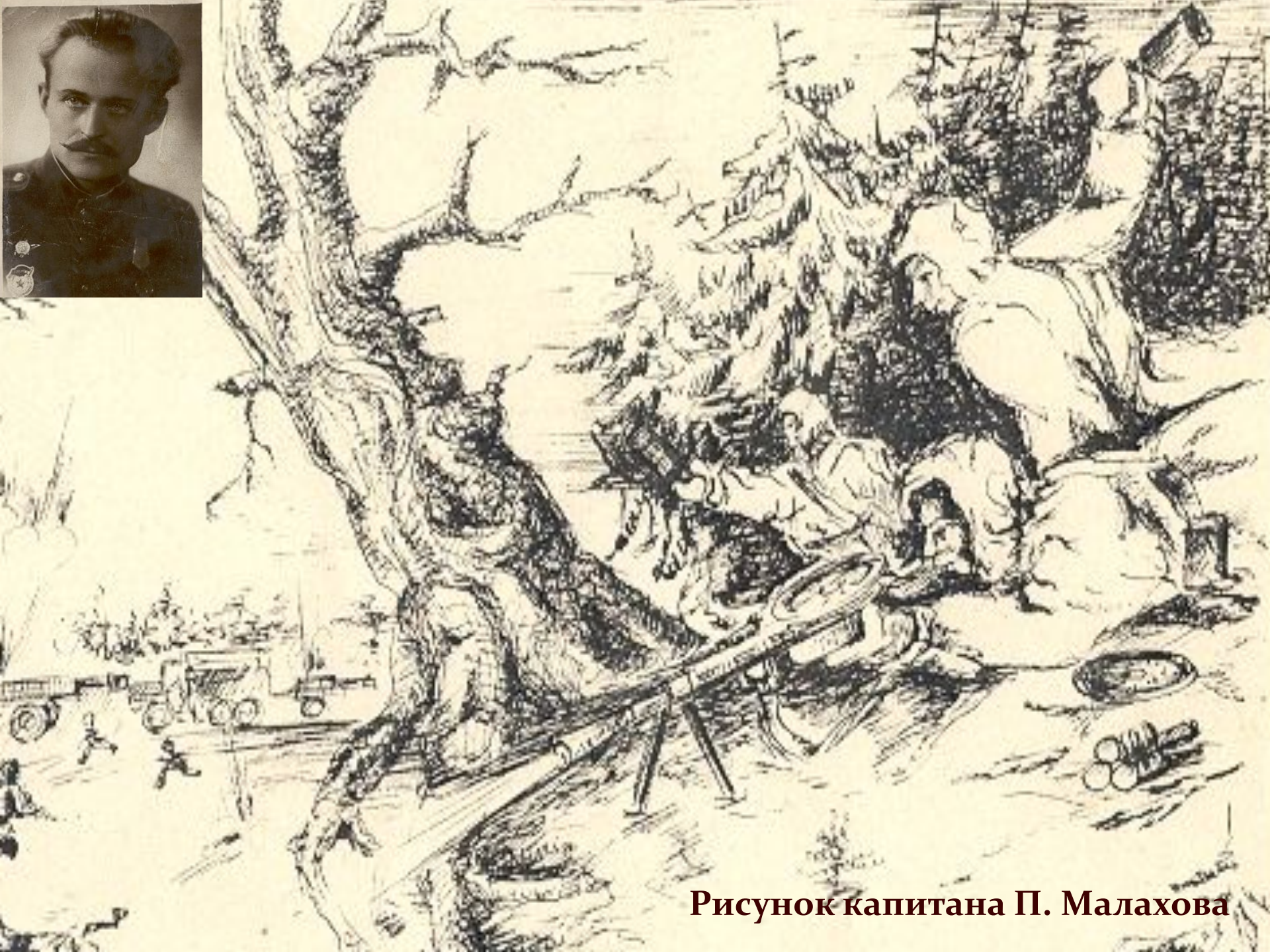
Рисунок капитана П. Малахова